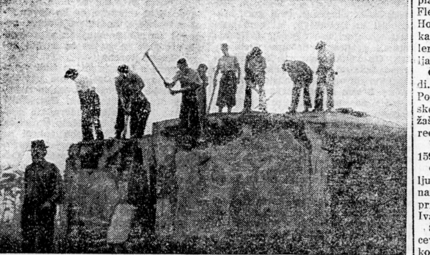
V megljenem jutru so zapeli krampi in lopate. Ljubljana se je s krepkimi zamah, bodro voljo in dovptom poslavljalá od betonskih in žičnih pregrad, v katere je za težka 3 leta gradil okupator z domačim izdajalcem

Vsa Ljubljana je v nedeljo pokazala, da se zaveda časa in njegovih zahtev. Vsi so prišli za krampe in lopate, od pionirjev do starčkov. V zgodnjih jutranjih urah so z zastavami in s petjem, veselji in razigranim odhajali na delo. Lenuhe, ki so ostali doma, je bilo sram in se niso upali pokazati na cesti, ker kamor koli so prišli, so našli na skupine zavednih delavnih ljubljánčanov. Reakcionarji in tisti, ki še do sedaj niso razumeli svoje dolžnosti, so lahko jasno videli, da zavedno ljudstvo ne samo govori o potrebnosti dela, ampak brez pomišljanja tudi prima za delo. Ta nedelja naj bo tem ljudem šola in vzgled, kako dela ljudstvo, ki se zaveda svoje dolžnosti, ljudstvo, ki ve, da bo imelo to, kar si bo ustvarilo. Ljudje, ki si bodo z delom ustvarili ljubo bodočnost, ne bodo trpeli v svojih vrstah lenuhov in zavestnih saboterjev.