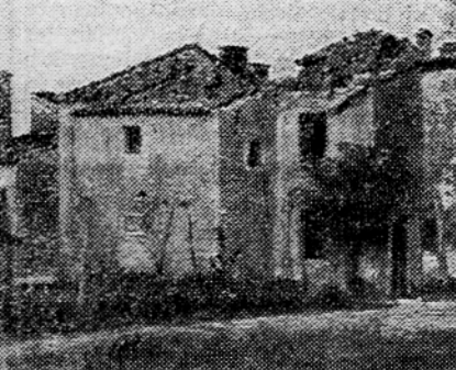
Lesenjača sredi razrušenih Lokey

Prav tako kot vasi so Svabi uničili mostove. Vendar so Primorci že povsod obnovili promet. Pri Dobravljah so sezidali betonske mostove in