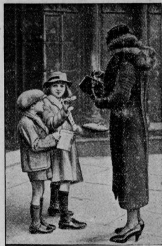
Pariški otroci po ulicah nabirajo za spomenik kralja Aleksandra. Spomenik bodo postavili v Parizu.