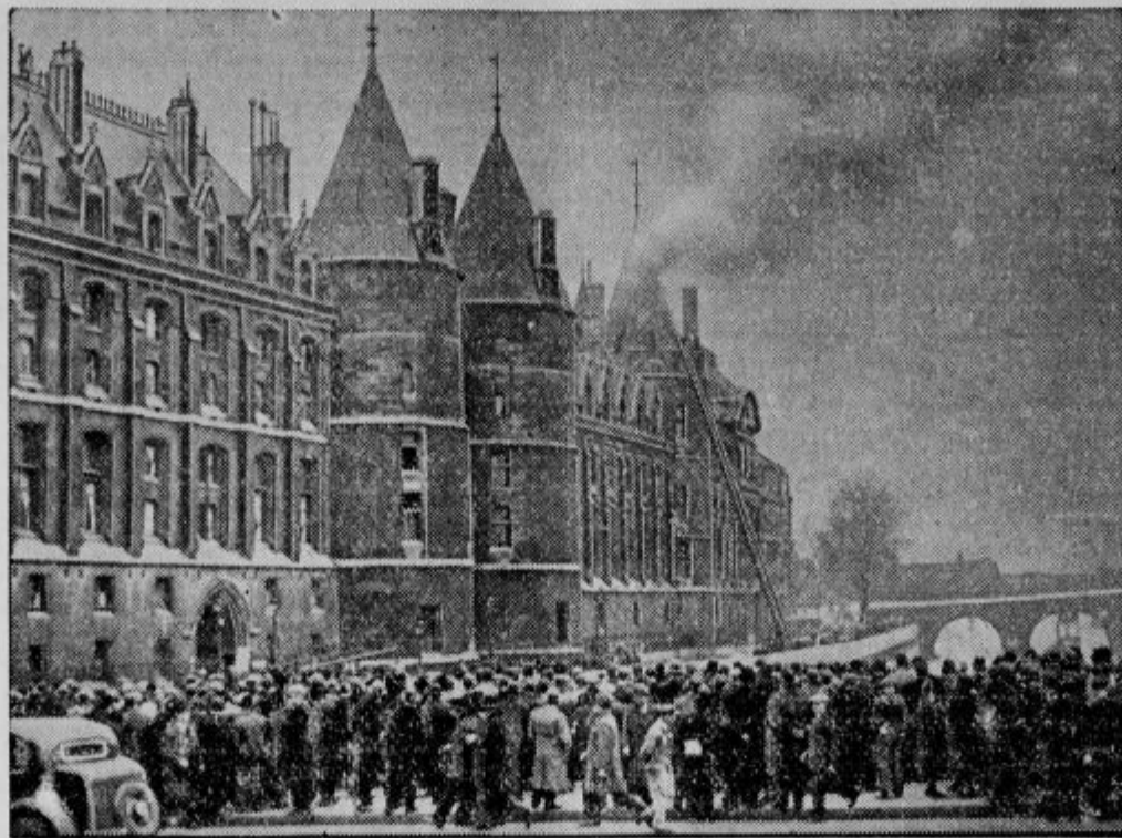
Sloveča pariška justična palača je gorela. Gasilci so požar omejili, da je pogorel le del enega stolpa (Stolp sv. Ludovika).

Najveličastnejši spomin na Boromejce pa je v Milanu, to je grob velikega Karla Boromejskega v milanski stolnici, palača Boromejcev in pa svetovno slavna knjižnica Ambrosiana, katero je ustanovil kardinal Friderik Boromejski in v kateri je deloval kot knjižničar msgr. Ahile Ratti, sedanji naš papež Pij XI.