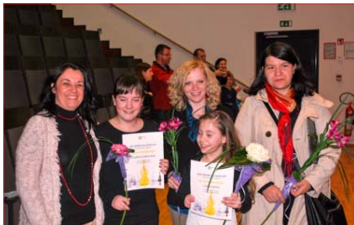
Violinisti iz Zasedne glasbene šole v samostanu sv. Petra in Pavla na Ptujju so se udeležili četrtega festivala mladih violinistov Jaz imam pa goslice , ki je potekal 14. aprila.