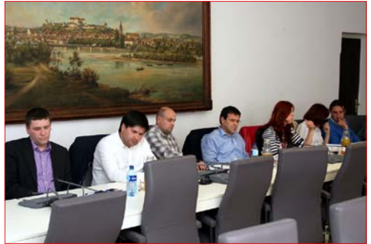
V zadnjem času je čutiti večjo dinamiko urejanja zadev med občinami Spodnjega Podravja.