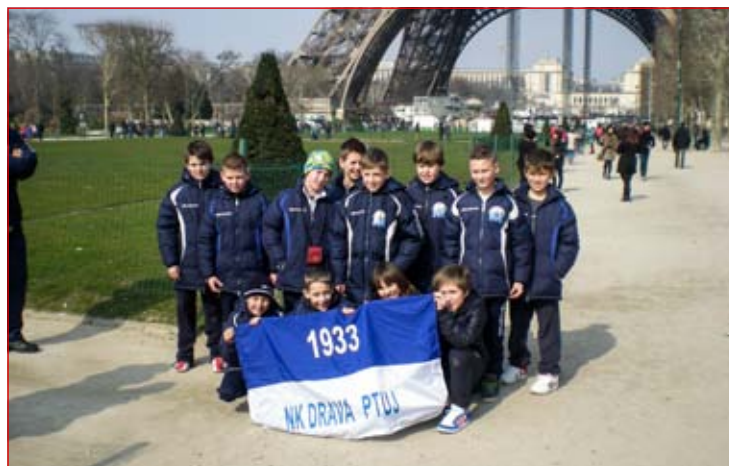
Pot nas je vodila tudi skozi Pariz, kjer smo si ogledali znameniti Eifflov stolp.

Tako je za nami štiridnevna izkušnja, klub smo predstavili z dobrimi igrami, igralci pa so pokazali veliko mero tehničnega in taktičnega znanja, s katerim smo zasenčili večino ekip na tem turnirju. Za igralce sta bila to velik dogodek in bogata izkušnja, v kateri so se lahko primerjali z vrstniki iz drugih