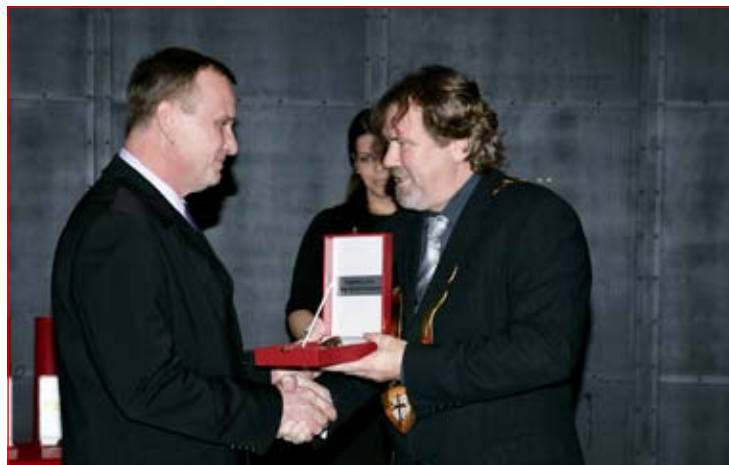
Ob kulturnem prazniku v dvorani Gimnazije direktor ptujske knjižnice prejema oljenko.

Na vprašanje, kaj mu pomeni priznanje, pove, da veliko in da se zaveda, da je to priznanje celotnemu kolektivu za opravljeno delo v zadnjih osmih letih. Na-