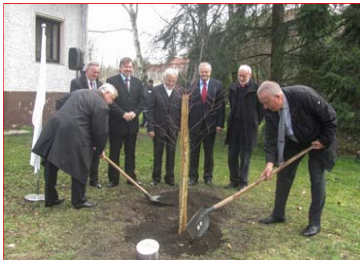
Brezo sta simbolno zasadila predsednika pobratenih društev Bela krajina in Društva prijateljev Ptuj iz Ljubljane.