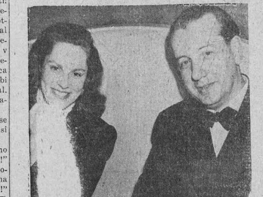
Svedska filmska zvezda Viveca Lindfors je priletela z letalom iz Stockholma v New York. Poleg nje je njen soprog. Viveca je na poti v Hollywood, kjer bo nastopala v nekem filmu, ki ga imajo sedaj v delu.

NEWBURSKE NOVICE Naš P. T. A. je jako delaven in v veliko pomoč šoli. Vsi starši bi se morali zanimati in vsaj matere, katere imajo otroke v šoli, bi se morale redno udeleževati njih sej. Odbor sam ne more vsemu kaj. Nekdo pravi: "Mink (vidra) v omari je dostikrat kriv, da je volk pred vratmi." ženske, al razumete? Pa ne, da bi bil jaz komu nevoščljiv kožuha. "Lepa beseda v odgovor na grdo je veliko vredna pa malo stane," pravi neki kitajski pregovor. Pa je res tako. Koliko prepira bi se ognili, če bi vedno vsi tako delali. Še je čas, kdor bi želel pristopiti k novemu moškemu zboru. Tudi za godbo še nimamo zadostno število. Come along.