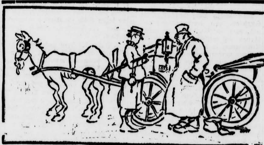
„Warum hängt denn Ihrem Pferdchen die Zunge so weit aus dem Malle?“ Kutscher: „Weil der Kopp zu klein is“.

Die Augen sind unser Schaufenster, sie werden nachts geschlossen.