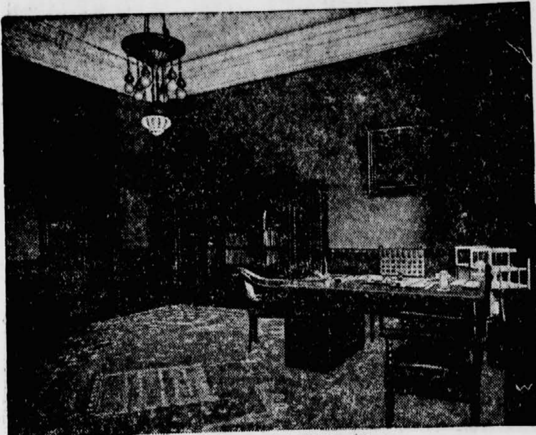
Das Arbeitszimmer des Reichspräsidenten.

die Kasapna ulica ging, bemerkte ich in der nächsten Nähe des Wafenmeisters rechts von der Straße große Haufen von Stahl- und anderem Metall. Es war gerade nach einem Regenguß und die Straße floß so „herzallerliebste“ über die öffentliche Straße, als wie in einem Bauernhofe am Draufelbe. Das ist für die nächste Nähe und Umgebung der Stadt doch etwas stark! Ich weiß zwar nicht, wer der Herr dieses Metallhaufens ist, aber die Straßenpolizei sollte doch etwas mehr auf die Reinlichkeit der öffentlichen Wege und Gassen schauen. Wir hoffen, daß der Uebelstand schnelligst beseitigt wird. Ein Magdalenenorständler.