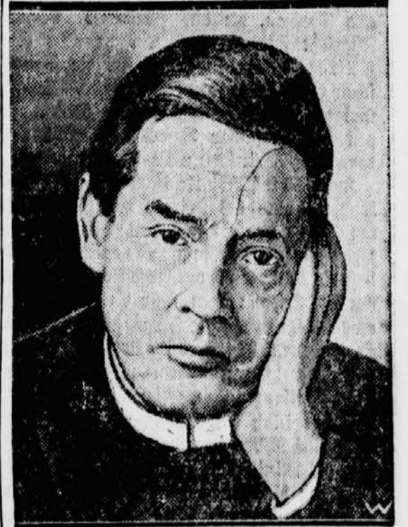
Der Schweizer Dichter Heinrich Federer als Preissträger.

Der bekannte Schweizer Dichter Heinrich Federer, der Verfasser von „Sisto e Sesto“ und dem „Lehten Ständlein des Papstes“, hat für seinen letzten Roman „Papst und Kaiser auf dem Dorfe“ den Gottfried-Keller-Preis der Martin-Bodmer-Stiftung in Zürich von 6000 Franken erhalten.