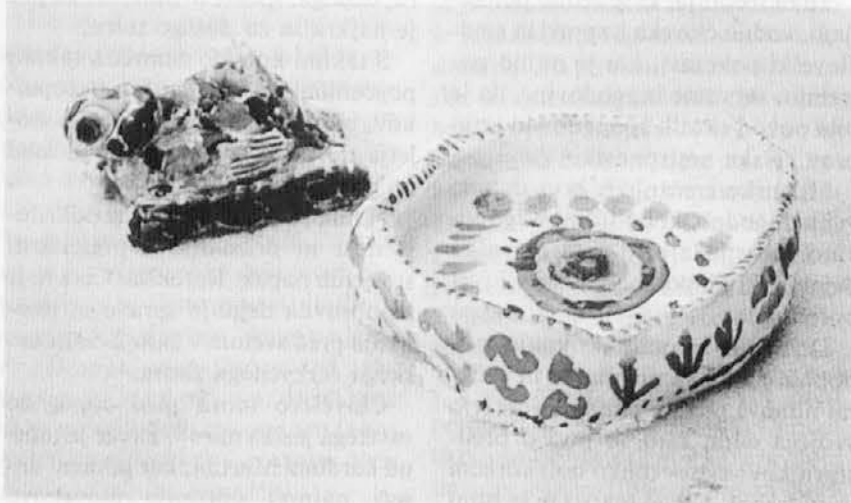
Dva izdelka učencev goriške o.š. Oton Župančič