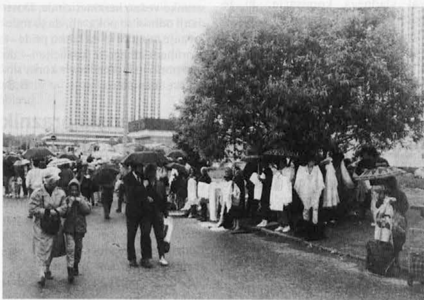
Tržnica Izmajlove v Moskvi

Ko se mu pokvari vozilo (avto, tovornjak ali karkoli že), se Moskovčan prav nič ne vznemirja, kako naj ga spravi s cestišča v stran, da ne bi oviralo prometa. Pusti ga tam sredi ceste, kjer se je pokvarilo in ustavilo, pa naj bo na križišču, ovinu ali v predoru. Vse, kar naredi, je to, da postavi 5 m pred avto staro vedro ali kamen (tudi tega ne vedno), ki opozarja na pokvarjeno vozilo. Trikotnika ne postavi, ker bi mu ga gotovo ukradli. Potem, če je vozilo njegovo, začne marljivo šariti