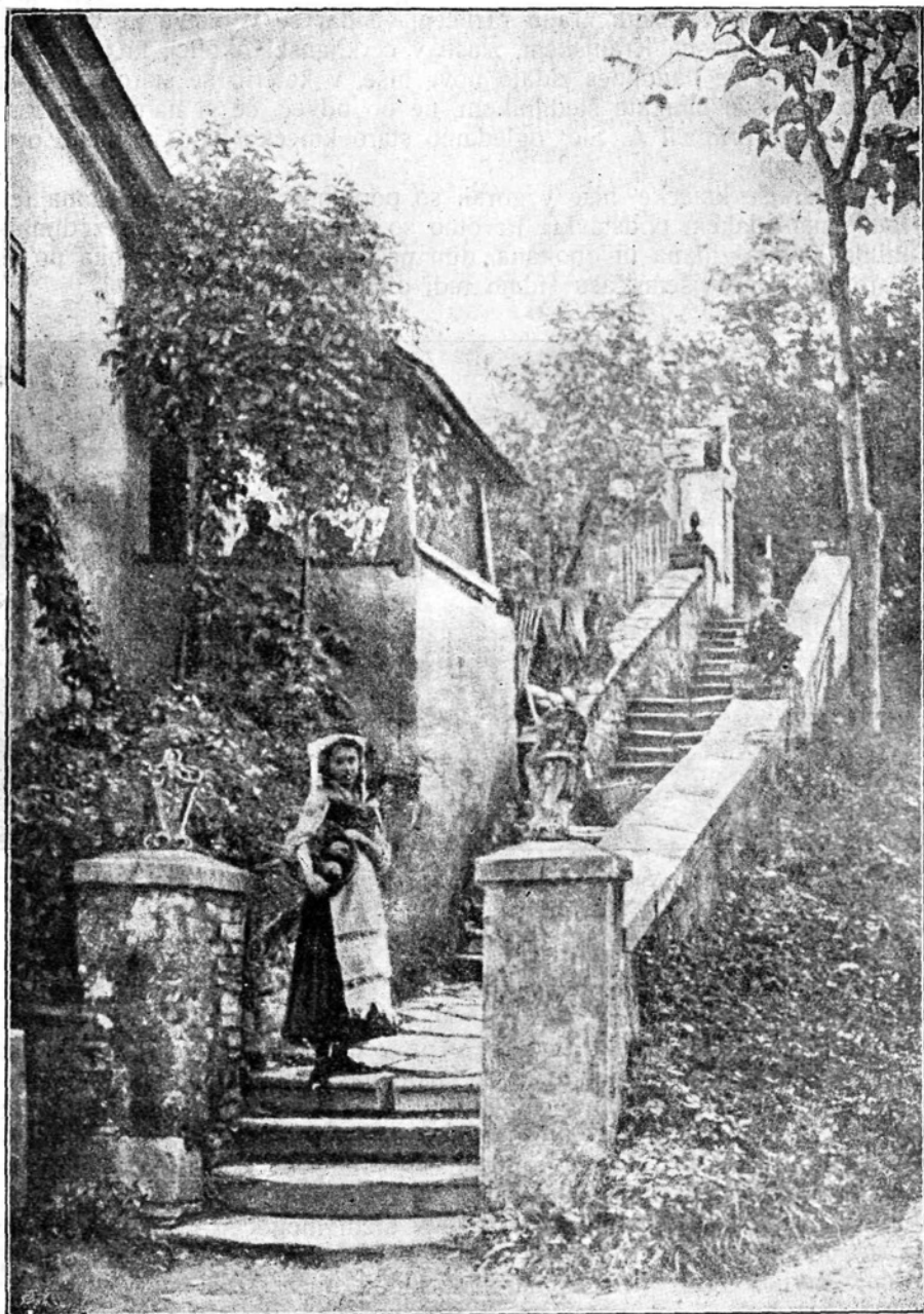
Hiša v tržaški okolici.

Hlevi so pri starih hišah leseni. Drvarnice redno nimajo, pač pa zložijo drva navadno okrog hiše v skladovnice, ki segajo do podstrejša.