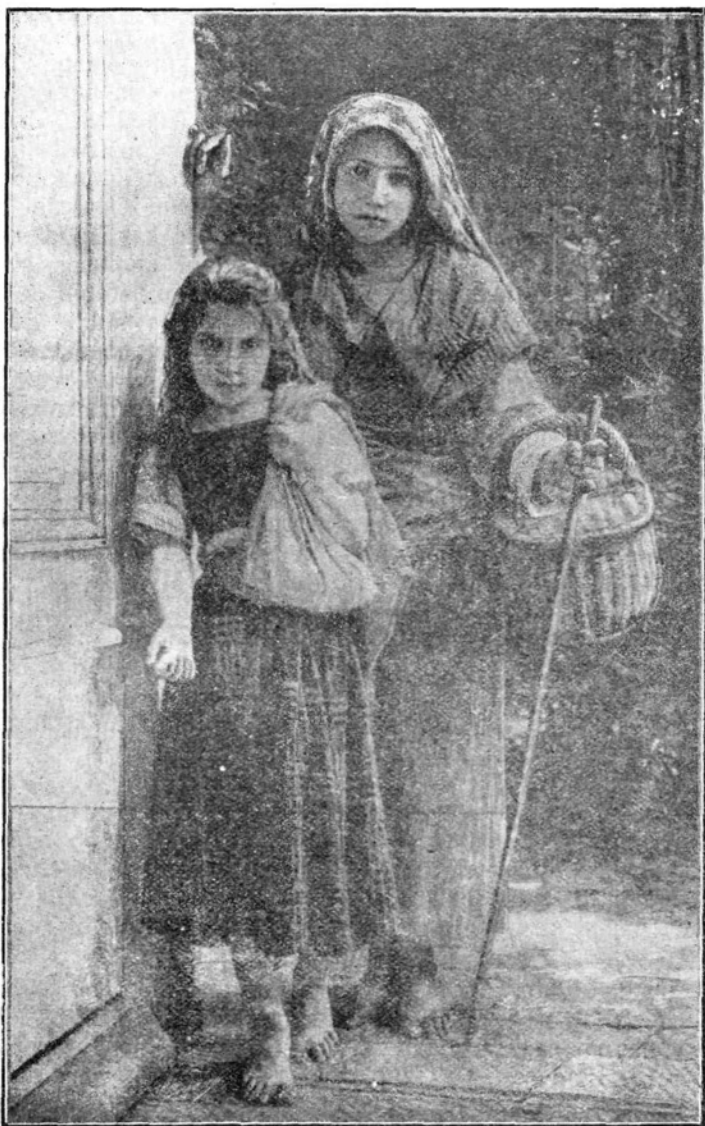
Še nama božičnih darov !

Zabava mora biti tako urejena, da ohrani vsaka članica in vsak opazovalec vtis, da je krožek resna vzgojna in vsestransko izobraževalna organi-