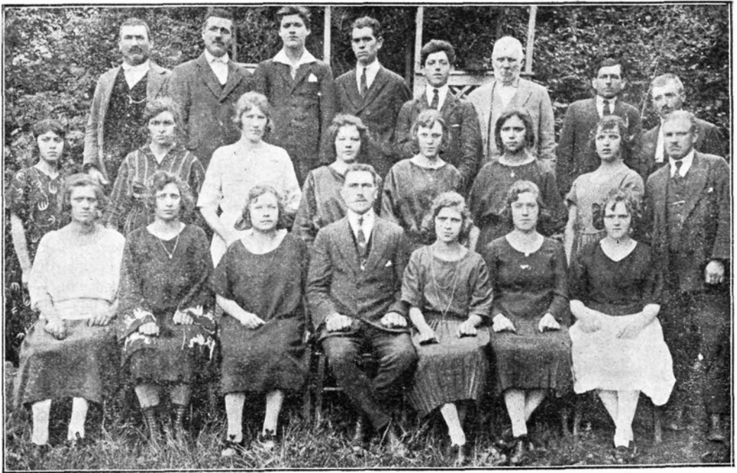
Izobraževalno društvo v Saksidu.

propagandnih šol za posebno vnete gospodične in tudi preprosta dekleta. Da boste lahko razumele nalogo te šole, vam povem zgled. V vašem krožku rabite socialna, gospodinjska, versko-apologetična, vzgojna in druga predavanja. Kdo naj predava? Navadno se obračate do „Prosv. zveze“. Toda društev je veliko in doktorjev ter drugih akademski naobraženih predavateljev je malo, zato vam „Prosv. zveza“ ne more tako postreči, kakor bi rada. V vašem društvu rabite predavanja vsak teden, ne pa le vsake kvatre ali še manj. Kako odpomoči temu? Morda imate v vašem društvu nekoliko vnetih izobražencev, morda, a le malokje. Navadno je edini inteligent, ki bi mogel predavati, le duhovnik in še ta ima drugega dela čez glavo; zlasti starejši gospodje se ne morejo navezati za stalno. Te težave ima tudi italij. mladinsko gibanje. Odpraviti jih hoče z imenovanimi šolami. V središču ali tudi po večjih krajih na deželi ustanovijo propagandne šole, v katere sprejemajo nadarjena dekleta, ki imajo dobro voljo in veselje, žrtvovati se za ideale mladinskega gibanja. In česa se učijo v teh šolah? Predvsem jim priredijo celo vrsto predavanj o dekliški organizaciji sami, proučijo natančno njen poslovnik, v raz-