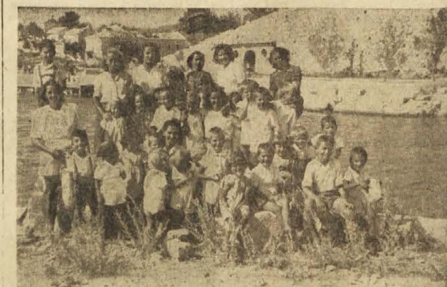
Skupina slovenskih pionirjev v počitniški koloniji v Bakru

V državi je 11 srednjih gozdarskih šol. Med petletko se mora povečati število gozdarskih inženirjev na 120, gozdarskih tehnikov pa na 1960. Potrebni so tudi številni strokovnjaki z nižjo strokovno izobrazbo. V ta namen so bile ustanovljene številne šole, od najnižjih do najvišjih. V srednjih šolah traja pouk skupaj s prakso 5 leta in pol. V šolo sprejemajo dijake z malo maturo. Nižjih gozdarskih šol je 8. Pouk traja leto dni.