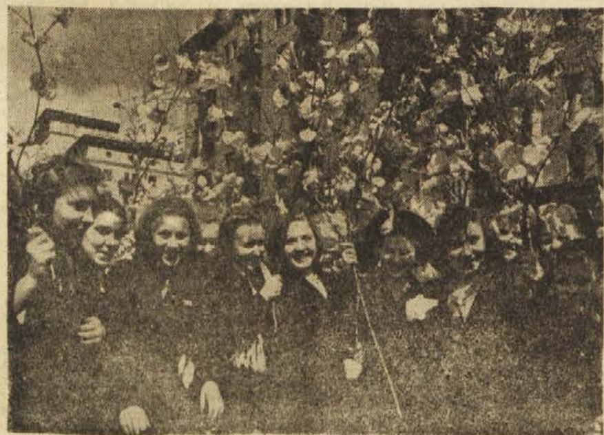
Mlade Moskovčanke na manitestaciji