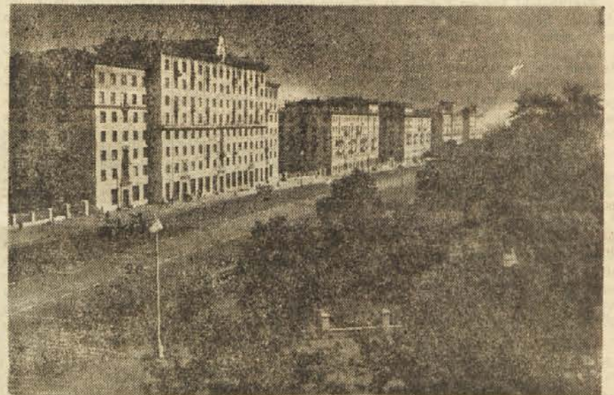
Velika Kalužska ulica

že osem stoletij stoji veliko mesto ob reki Moskvi. In sredi njega stoji Kremlj. Če je res, da je Moskva srce sovjetske domovine, so Kremlj njeni možgani. Tu je živel Vladimir Iljič Lenin. Tu živi veliki Stalin. Tu je sedež sovjetske vlade. Vsak, kdor pride v Moskvo, pa naj bo sovjetski državljani ali tujec, se napoti najprej na Rdeči trg, da vidi Kremlj, njegove stene, Spaska vrata. Velik je zgodovinski pomen moskovskega Kremlja kot enega izmed spomenikov ruske arhitekture. Vsaka opeka kremljske stene ali stolpa kaže sledove mnogih stoletij.