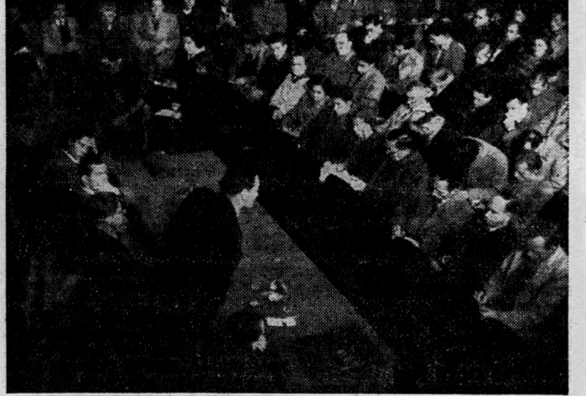
Minister Boris Kidrič je večer govoril na volivnem zborovanju v mladinski dvorani v Ljubljani o gospodarskih vprašanjih

Kočevje je napovedalo volivno tekmovanje Črnomlju, Ribnica Kočevjska, Dol. vas Fari, Rakitnica Koprivniku, MOOF Kočevje Novemu mestu, Šalka vas Dolgi vasi in Ljavidu. Tekmovali bodo predvsem v volivni udeležbi.