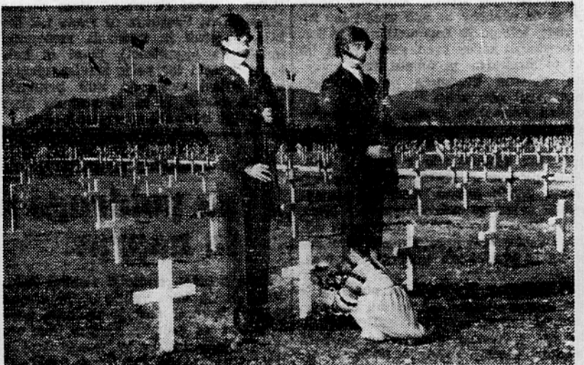
Korejska deklica je prinesla cvetlice na grobove padlih vojakov OZN na pokopališču v Fusanu