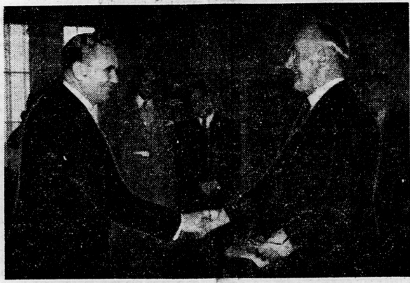
Zastopstvo britanskega parlamenta pri maršalu Titu