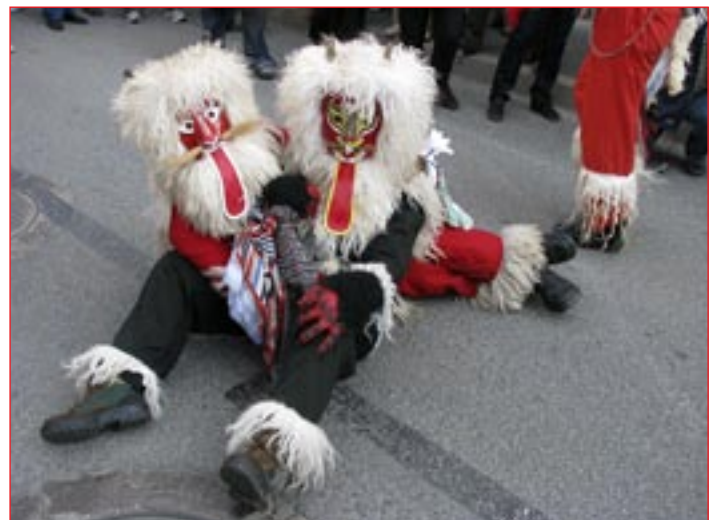
Videlo nas je skoraj 50 000 obiskovalcev prireditve Sol y Fiesta.

Mesto Leucate je zelo aktivno na področju organizacije prireditev predvsem v času turistične sezone. Vsako leto ob številnih manjših prireditvah organizirajo štiri velike, večdnevne dogodke. Eden izmed teh dogodkov je tridnevni festival petja in plesa Sol y Fiesta. To je tradicionalno praznovanje z mediteranskim pridihom, kot gledališče na prostem oziroma ulični spektakel.