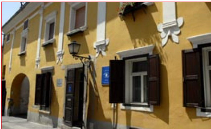
Četrtna skupnost Center ima v upravljanju stavbi na Potrčevi 34 ter na Jadranski 6.

v šolskih telovadnicah za tak namen ni. Za skupino 10 do 20 ljudi je dovolj malo večji prostor s potrebno infrastrukturo, kot npr. telovadnica v nekdanjem dijaškem domu na Prešernovi 29. Predlagamo, da bi imeli na vsakih 1000 ljudi vsaj po en prostor,