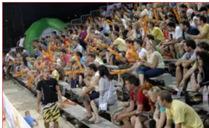
V štirih dneh si je tekme ogledalo 5000 ljudi.

je bil prost. V glavnem delu mednarodnega turnirja, ki šteje tudi za pokal Slovenije 2010, je nastopilo 16 moških in 16 ženskih ekip. Prvi dan je bil rezerviran za kvalifikacije, drugi in zadnji dan pa so se odvile prve tekme glavnega turnirja ter polfinalni obračuni in zaključni boji za najboljše ekipe. Na turnirju so sodelovale vse najboljše slovenske ekipe, konkurenco pa so povečale tudi dvojice iz šestih tujih držav – Hrvaške, Srbije, Španije, Švedske, Danske in Slovaške.