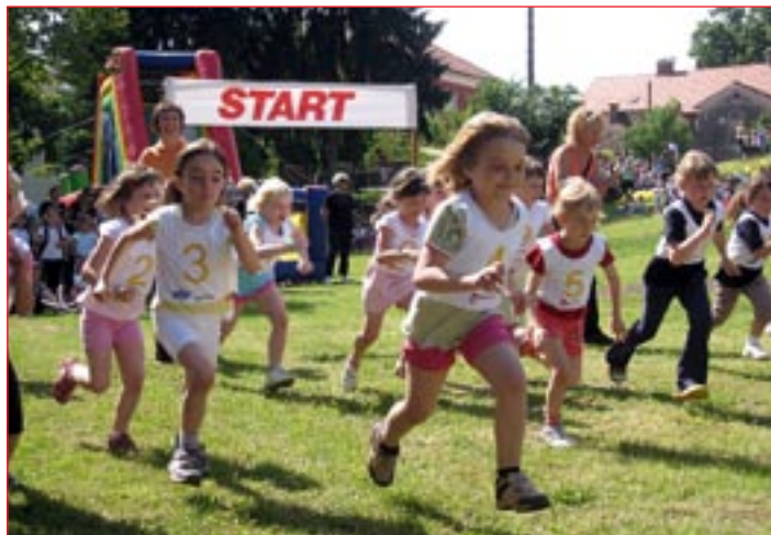
Otroci so tekli na 31. krosu Vrta Ptuj ter na tretjem medobčinskem krosu.

Isti dan, 26. maja, pa je Perutnina Ptuj nagradila 22 otrok iz ptujskih vrtcev za njihove slikarske izdelke na temo POLI in promet ter vsem sodelujočim otrokom na istoimenskem natečaju podelila simbolične nagrade. V družbeno odgovornem projektu POLI in promet je Perutnina Ptuj za namene oblikovanja koledarja POLI 2010 k sodelovanju povabila Vrtec Ptuj in pripravila natečaj za najboljših deset risbic in deset najboljših pobarvank. »Odziv je bil tolikšen, da smo se odločili, da bomo podelili še dve