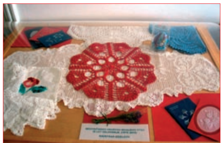
Čudoviti izdelki pridnih in spretnih rok članic društva.

Cilji delovanja društva so kakovost življenja invalidov,