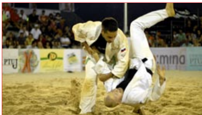
Med tekmami je bilo poskrbljeno za bogat animacijski program. Predstavili so se tudi člani društva Aikido klub Ptuj.

je tudi letos vpeljal evropske standarde organiziranja mednarodnih tekem. Obiskovalce so med adrenalinskimi tekmami animirale plesne skupine, vstop