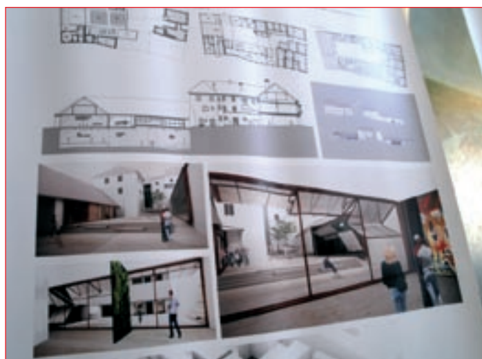
Projekt obnove Stare steklarške.

po koncu projekta Evropska prestolnica kulture Maribor 2012, katere pomembni partner je tudi Ptuj (poleg Murske Sobote, Novega mesta, Slovenj Gradca ter Velenja).