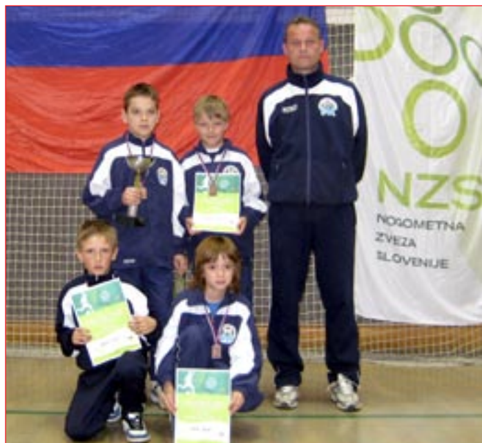
Državni prvaki s Ptujja v tekmovalju Rad igram nogomet – U8.

Zadnja leta so se sponzorji in donatorji že ustalili v naši sredini ter pri podpiranju zdravega načina življenja na Ptujju in v okolici. Tisti, ki so v letošnjem letu pomagali skrbeti za varno