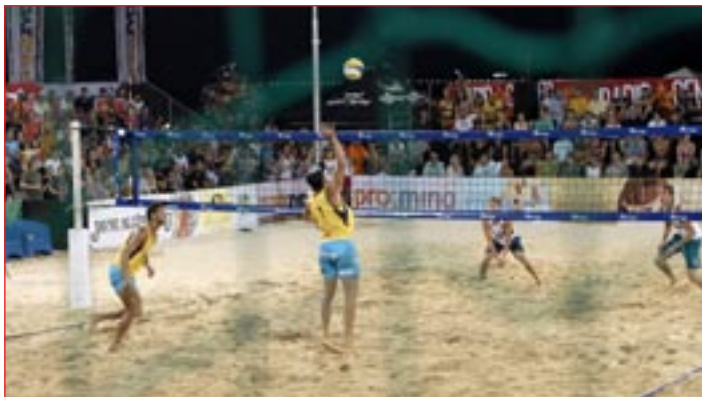
Na mednarodnem turnirju je nastopilo 16 moških in 16 ženskih ekip iz 7 držav.

stike z javnostmi. BeachMaster 2011 bo predvidoma potekal od 13. do 16. julija 2011.