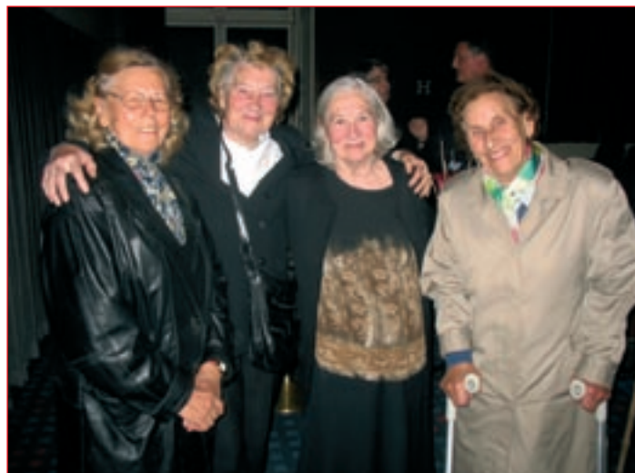
Ptujske ženske starejše generacije so z veseljem poklepetale s slovensko filmsko in gledališko igralko Štefko Drolc.

Filmski večer na Ptujju sta s svojo prisotnostjo počastila cenjena gosta. Igralka Štefka Drolc je slikovito spregovorila o vsebini filma in kot opomin zbrane spomnila na grozote druge sve-