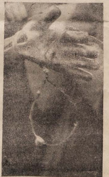
Sv. Urh: Pri izkopani žrtvi domobranskega nasilja je komisija našla okoli vratu zadržano zanko iz žice.

Danes bo ob 17. uri na grobovih talcev pri Sv. Križu spominška žalna svečanost, kjer bomo počastili vse, ki so padli za našo veliko svobodo.