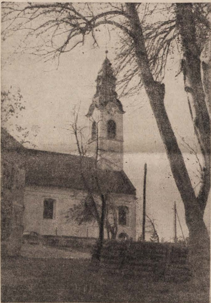
Cerkev pri Sv. Urhu, kjer so poživljeni domobranci z blagoslovom škofa dr. Rožmana in ob aktivnem sodelovanju protiljudske duhovščine v župnišču zverinsko mučili in nato pobili na stotine svobodoljubnih Slovencev. Grobovi talcev so kot cvetoči vrtovi.