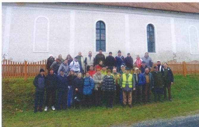
Zbrani pohodniki pred kalvinistično cerkev v Szentgyörgyvölgyu na Madžarskem. A túrázók a magyarországi Szentgyörgyvölgyön a református templom előtt.