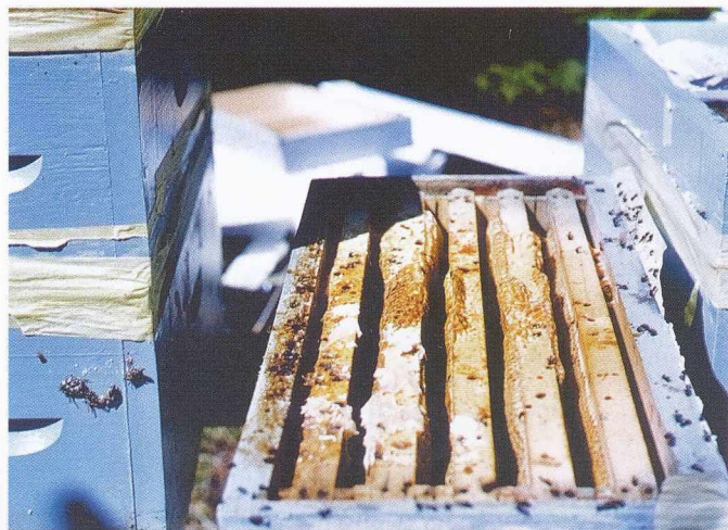
Onesnaženo satje z iztrebki okuženih čebel z N. apis