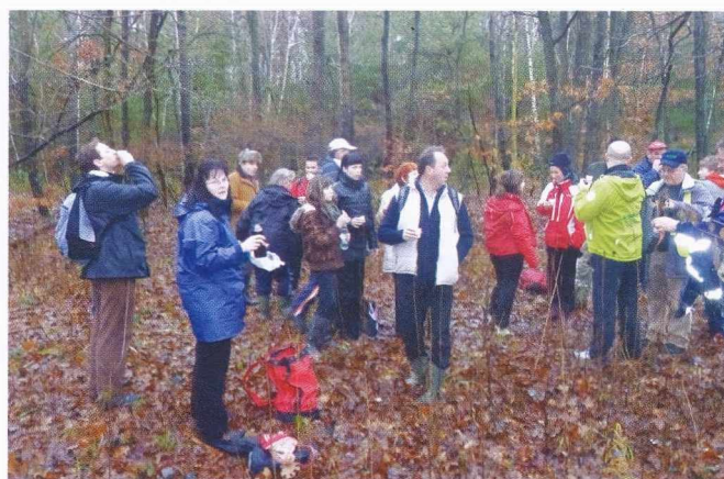
Ker je pot bila dolga (14 km), smo se med pohodom tudi malo okrepčali. Mert a gyalogtúra hosszú volt (14 km), közben felfrissültünk is egy kicsit.

A múltban az emberek életének fontos része volt a mozgás. Meg kellett művelni a földeket, távolságokat kellett áthidalni... Manapság azonban a technika fejlődése mindinkább kiszorítja a mindennapjainkból, ezért szükséges, hogy tudatosan építsünk be fizikai aktivitást az életünkbe. A szentlászlói József Attila Művelődési Egyesület és a Moravske Toplice Községi Magyar Nemzeti Öngazgatási Közösség tagjai arra ösztönözték a környék lakóit, hogy az ünnepek előtt is legyenek aktívak, és 2011. december 17-én megszervezték az 1. Adventi gyalogtúrát. Hagyományossá tételére a jövőben törekedni fogunk. Kora reggel, a rossz idő ellenére, a szentlászlói közös-