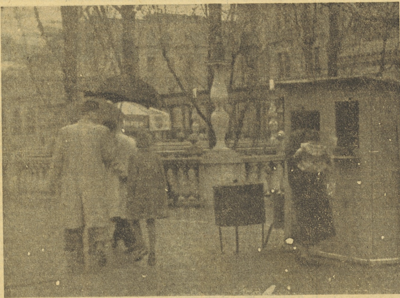
Jesen se je naselila v deželo in z njo vred deževni, mrzli dnevi in majhne kolibe, kjer Ljubljančanom pečejo kostanj