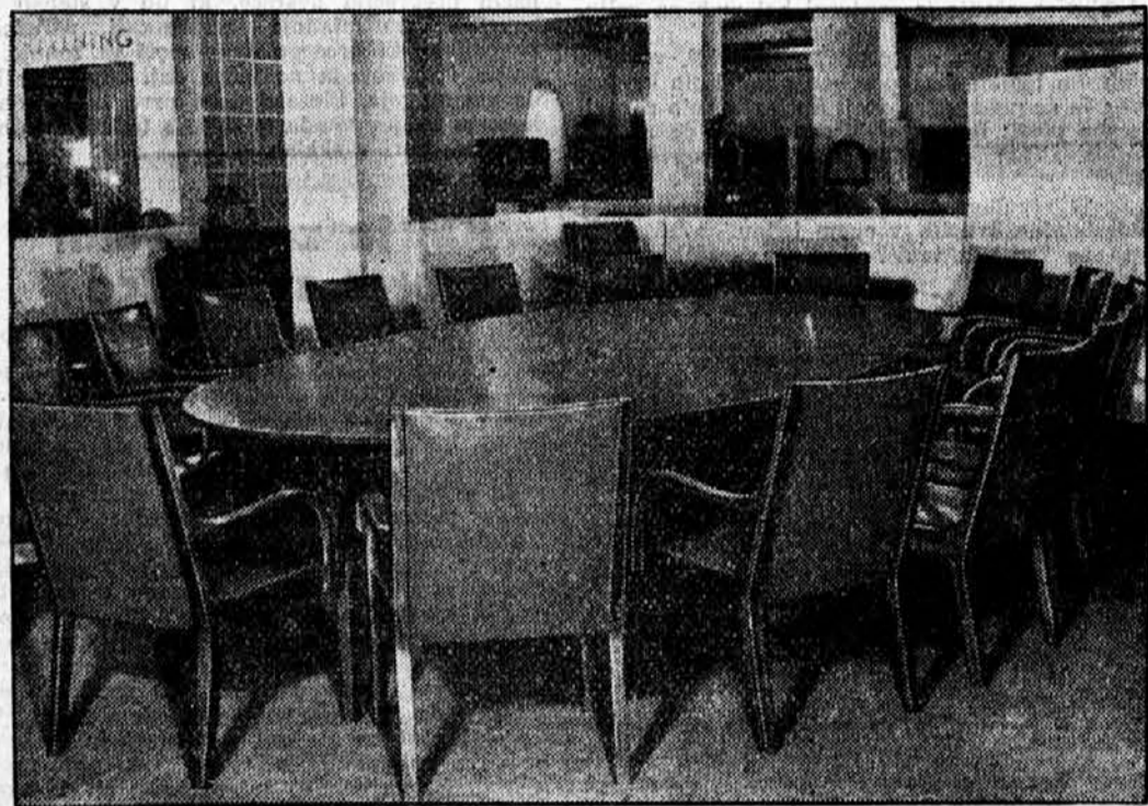
Krasna miza s stoli, ki so jo Švedji podarili Zvezi narodov.

»Sinoči je neznan bandit izvršil drzen napad na bančnika N. N. Oddal je nanj dva strela iz samokresa, ki pa sta na srečo zgrešila. Šele s tretjim strelom se je zločinca vendarle posrečilo ubiti svojo žrtev.«