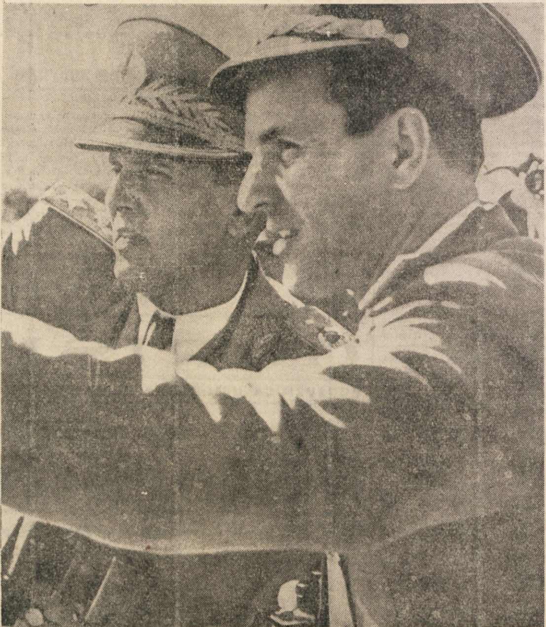
na zadnjih manevrih JA v Srbiji