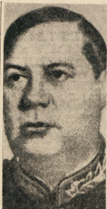
NEDAVNO UMRLI SLAVNI SOVJETSKI MARŠAL TOLBUKIN, KI JE SODELOVAL PRED PETIMI LETI PRI OSVOBODITVI JUGOSLOVANSKE PRESTOLNICE.

To je slika prvega novega Beograda, kot jo bomo čez nekaj