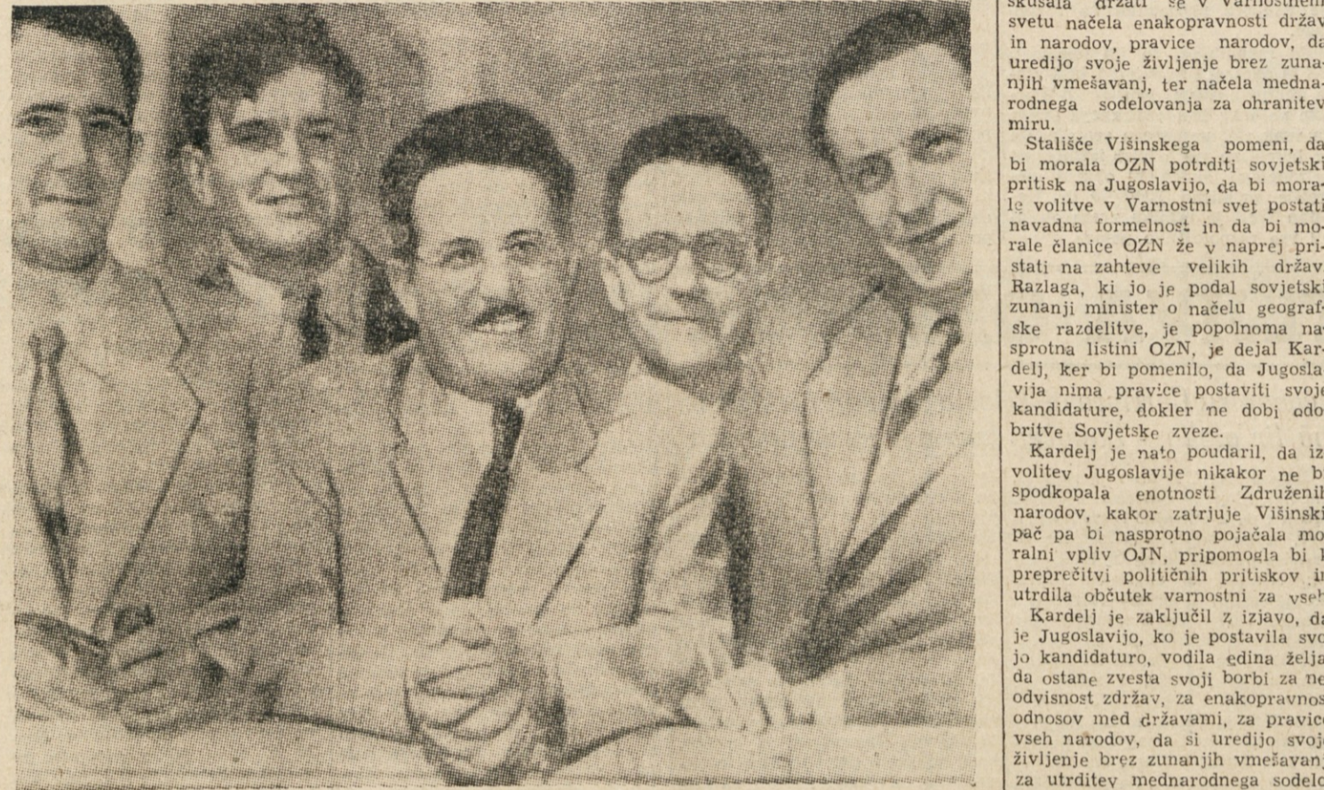
DELEGACIJA FLRJ NA ZASEDANJU GENERALNE SKUPSCINE OZN V LAKE SUCCESSU. — Z LEVE NA DESNO: MILOVAN DJILAS, VLADIMIR DEDIJER, EDVARDA KARDELJA, DR. JOZE VILFAN IN DR. ALES BEBLER.

Če bi se sprejelo sovjetsko stališče, bi pomenilo, da nobena neodvisna država Vzhodne Evrope ne more postaviti svoje kandidature brez odobritve vlade Sovjetske zveze