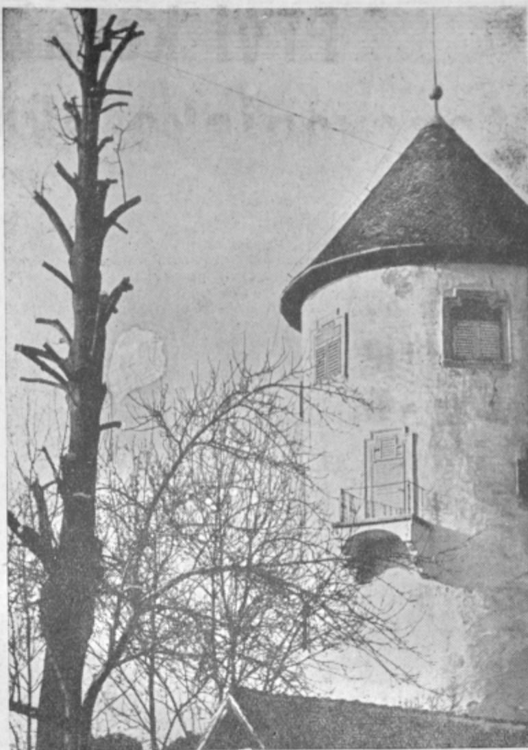
Motiv z velenjskega starega gradu

Višjo odkupno ceno plačujejo kmetu na ta način, da mu prevzamejo živino kot prvorazredno in mu jo plačajo po prosti ceni (180 do 190 dinarjev). Zadevo še pravno upravičijo s tem, da znižajo dejansko težo živini in s tem pri zakolu dokažejo višjo klavnost. S podobnimi malverzacijami plačajo za vola na primer tudi čez 20 tisoč dinarjev več kot v sosednjih zadrugah, kjer spoštujejo predpise. Razumljivo je, da so na ta način uspeli odkupiti več živine (torej več dohodka od marž) in da so celo zadružniki drugih zadrug začeli gnati živino v Rimske Toplice. Istočasno pa so s svojim ravnanjem povzročili zmedo na trgu, še posebej pa na svojem območju. Saj so na zadnjem posvetovanju kmetijskih strokovnjakov lahko že ugotovili, da število živine na tem območju bistveno upada in da občina Laško zaradi neodgovornega poslovanja Kmetijske zadruga Rimske Toplice in Jurkloster ne bo mogla izpolniti kmetijskega plana v živinoreji.