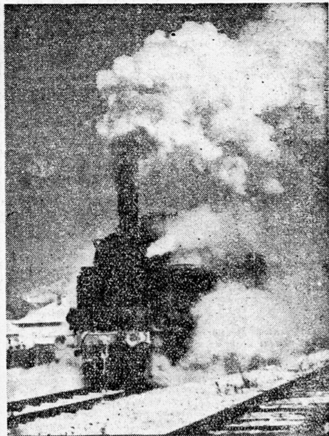
Z ognjem in soparo skozi mraz in burjo

London, 5. jan. (Tanjug). — Po mnenju nekaterih diplomatovskih opazovalcev v Londonu predstavlja govor, ki ga je imel sinoči predsednik ZDA Eisenhower na radiu in televiziji, novost v politiki ZDA.