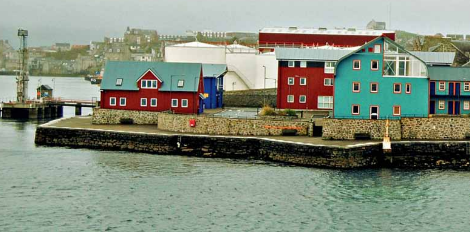
Del pristaniške vedute Lerwicka