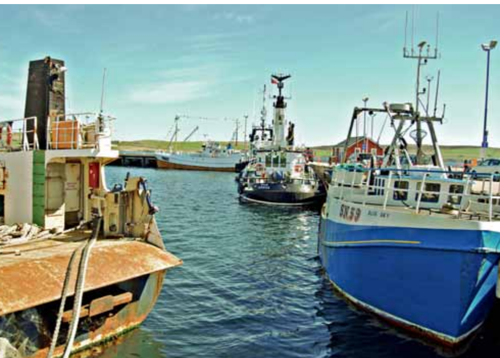
Ribiške ladje v pristanišču glavnega mesta Shetlandskih otokov, Lerwick.