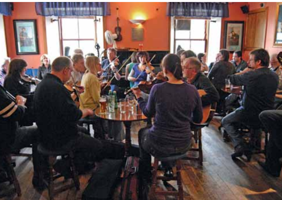
Tradicionalni »jam session« v znamenitem lerwiškem pubu The Lounge Bar

ni vremenski napovedi sredi vzpona ali pohajkovanja zabredete v gosto meglo ali močan naliv. Da se, preprosto, izgubite. Vsako leto se tako izgubi tudi kak turist. Nekateri za vedno. Ni čudno, da toliko otoških pripovedk govori o ljudeh, ki so jih ugrabila vilinska bitja (fairy folk po škotsko) ali troli (trows – ti imajo domicil predvsem na Orkneyjskih in Shetlandskih otokih) in za katerimi se je izgubila vsaka sled. No, nekaterim se je na primer po sedmih letih služenja vilinski kraljici ali glasbenem kratkočasenju trolov (troli še posebno obožujejo goslaške napeve) celo uspelo vrniti, obdarjeni z materialnim bogastvom ali na novo pridobljenimi magičnimi spodobnostmi.