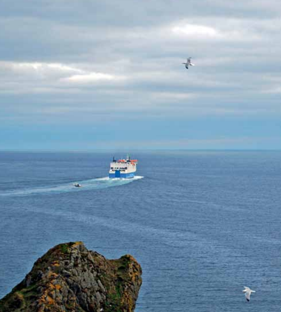
Trajekt Northlink je najpomembnejša morska povezava med Shetlandi in celino.