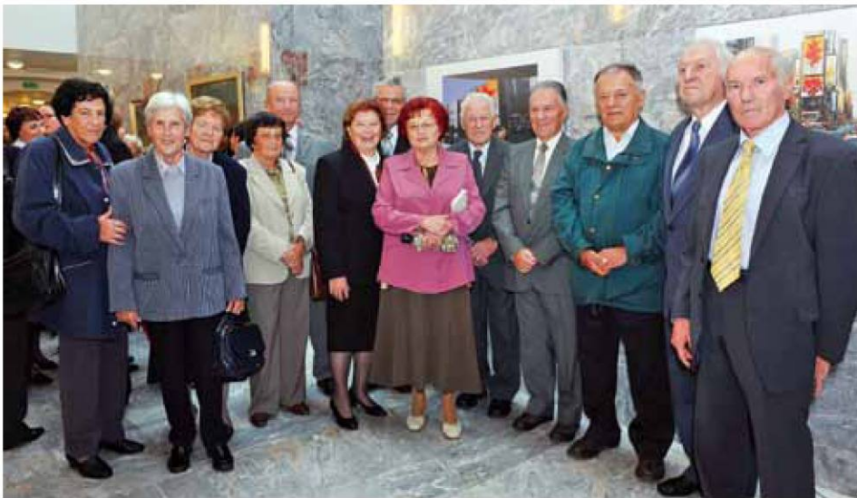
Udeleženci slavnostne akademije iz prve generacije škofjeloških maturantov.

Kakovost in zahtevnost šole sta rasli, število dijakov, ki smo se vpisali v višjo gimnazijo, je z leti padalo, po končanem 7. razredu jih je odpadlo sedem,