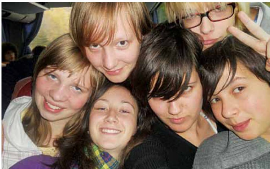
Veseli obrazi dijakinj in dijakov škofovške gimnazije. (iz fototeke Gimnazije Škofja Loka)

Vse to so resnična dejstva, vendar se za temi suhoparnimi številkami in frazami skriva vsakodnevni živ-žav najstnikov, ki vse od jutranjih ur do poznega popoldneva preživijo svoj delovni dan v šoli. Vsak od njih je svoja zgodba, s svojimi radostmi in problemi, in za vsakega od njih se je treba potruditi. Učiteljski zbor s svojim profesionalnim delom skrbi, da je učni program izpeljan tako, da ima vsak od naših dijakov možnost, da uspešno zaključi šolanje ter nadaljuje študij na akademski ravni.