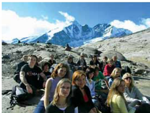
Skupaj z avstrijskimi dijaki na Grossglocknerju.

Hvala za 13 let čudovitih izkušenj. Hvala za trdo delo. Hvala za vaše gostoljubje in radodarnost.