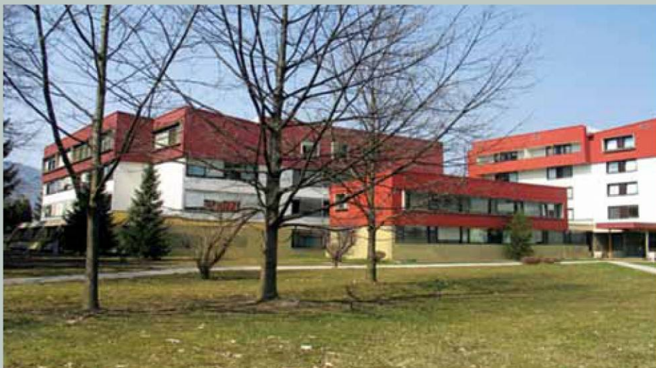
Poslopje Gimnazije Škofja Loka. (iz fototeke Gimnazije Škofja Loka)

Šola od leta 1991 dalje izvaja srednješolski splošnoizobraževalni program gimnazije in klasične gimnazije za potrebe srednješolskega izobraževanja dijakov iz Škofje Loke, Selške in Poljanske doline ter ostale južnogorenjske regije.