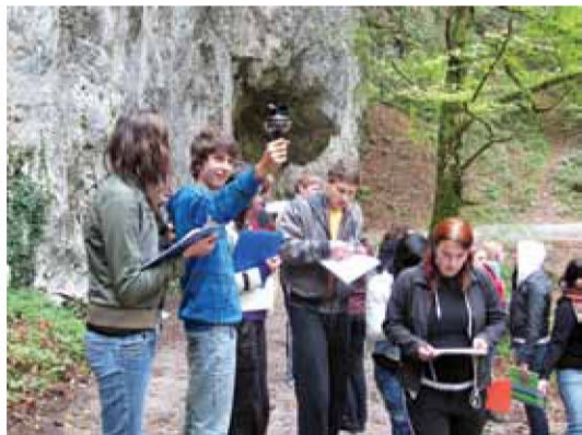
Projektno delo postaja pomemben del učnega procesa.

Današnji jubilej nam učiteljem Gimnazije Škofja Loka nalaga tudi dolžnosti. Zavedamo se odgovornosti, ki nam je naložena. Res je, naši dijaki radi hodijo v šolo in zato je na nas, učiteljih, da jim ponudimo tisto, po kar so prišli: znanje, veščine in spretnosti za njihov jutri, za njihovo prihodnost, kajti ravno njihovo delo pomeni tudi našo varnost in potrditev, da smo na pravi poti.