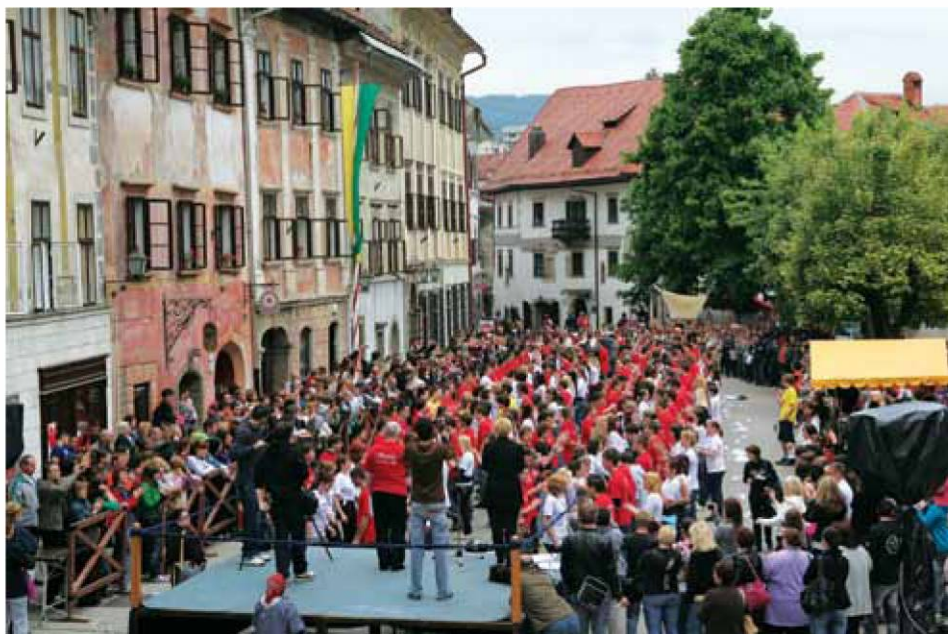
Letošnja generacija škofjeloških maturantov, med plesom četvorke na Mestnem trgu.

Ta štiri leta mojega življenja so bila zares čudovita in vedno jih bom hranila v spominu. Zato bi na koncu rada dodala le še tole – ponosna sem, da sem bila dijakinja Gimnazije Škofja Loka.