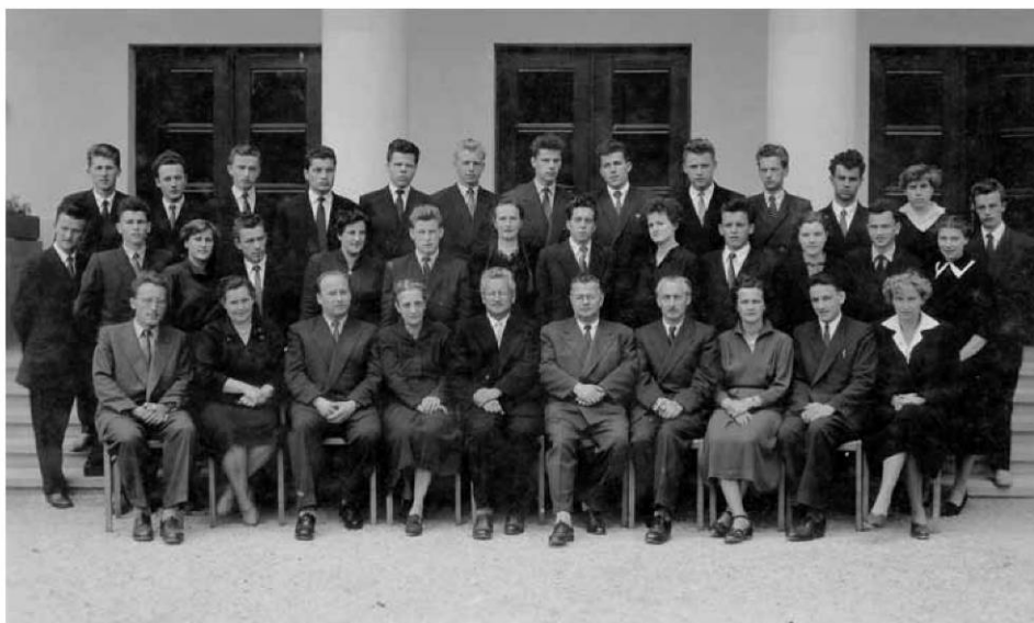
Prvi maturanti Gimnazije Škofja Loka in maturitetna komisija v Škofji Loki, 1955.

Gimnazija Škofja Loka je ob svojem jubileju prejela veliko voščil in lepih želja, tako od predstavnikov vladnih in lokalnih inštitucij, partnerskih šol in tudi staršev. Želijo nam, da uspešno nadaljujemo delo, veliko energije za delo z mladimi in veliko pedagoškega znanja za nove izzive. Zavedamo se, da je letošnji jubilej Gimnazije Škofja Loka obveza celotnemu učiteljskemu zboru, da svoje delo, ki temelji na dolgoletnih izkušnjah, nadaljuje tudi v prihodnje z namenom, da dijakom škofjeloške regije ponudi takšna znanja in veščine, da bodo z njihovo pomočjo uspeli doseči svoj življenjski sen.