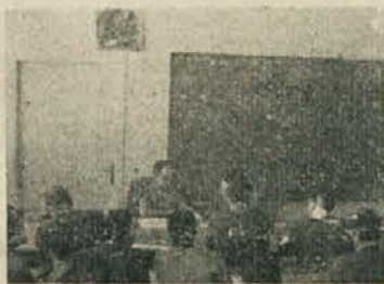
Izpitni na VTS

se lahko vpišejo s šestimi izpiti. Izredni slušatelji potrebujejo za prestop v drugi letnik šest izpitov, za pogojni vpis pa štiri izpite. Ti pogoji študentom niti ne povzročajo toliko težav, kot pozneje pogoji za četrti semester, ko morajo opraviti vse izpite iz prvega letnika.