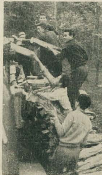
Na Kočevskem Rogu smo morali pljuniti v roke, če smo hoteli nadaljevati z vožnjo

vsaj v začetku svojega dela zaposleni na šoli samo honorarno kot asistenti, sicer pa bodo v rednem delovnem razmerju v kakšni gospodarski ali drugi organizaciji, kjer bodo opravljali podobno delo. Lahko pa se bo tak honorarni asistent razvil v rednega asistenta, predavatelja ali celo v docenta.« mm