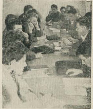
Seja na VTŠ

Na skupnem sestanku Zveze študentov in ZKJ na VTŠ so obravnavali novi statut šole. Predvsem so ugotovili, da so za svet letnika trije študentje premalo