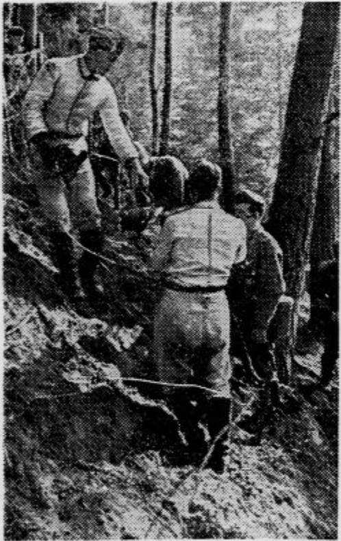
Nemški vojaki opletajo vmesni prostor med Siegfriedovo črto in Maginotovo linijo z bodočo žico