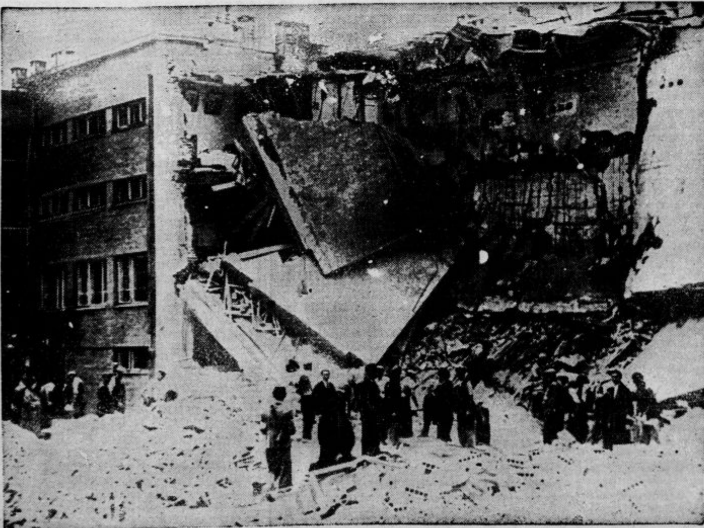
V predmestju Varšave je bomba z nemškega aeroplana porušila hišo