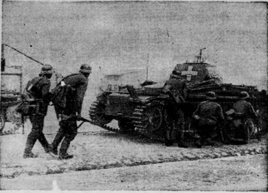
Nemška pehota je izvršila napad na Varšavo pod zaščito svojih tankov