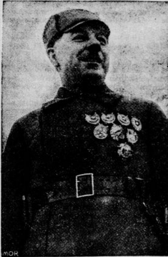
vrhovni poveljnik ruske vojske, ki je v noči od sobote na nedeljo prestopila poljsko mejo