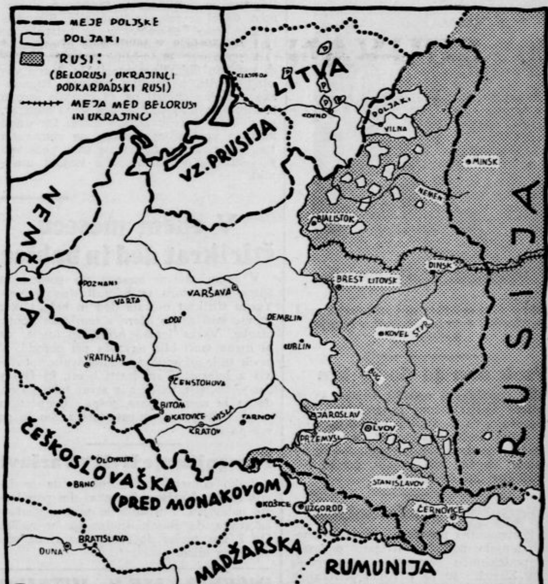
POLJSKO-RUSKA NARODNOSTNA MEJA

Glavni odbor JNS izraža svoje popolno zaupanje predsedniku stranke ter mu daje v duhu navedenih smernic proste roke za nadaljnje delo.