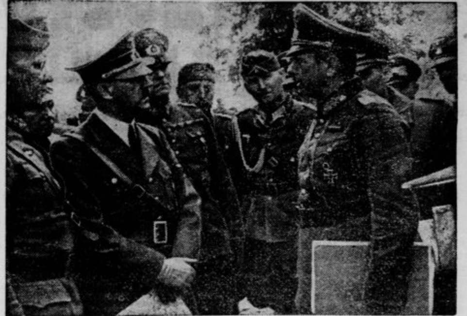
Državni kancelar Hitler se posvetuje s svojimi generali na poljskem bojišču