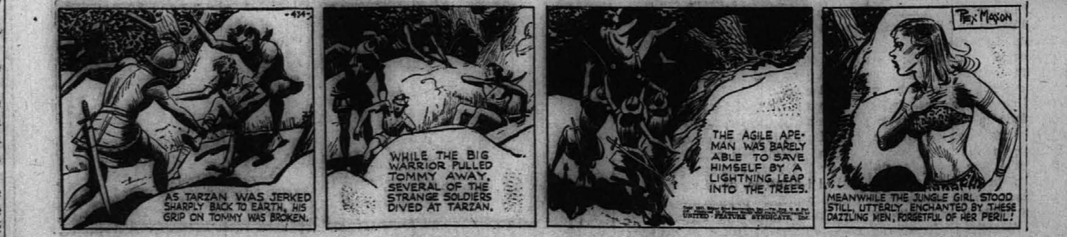
Ko je bil Tarzan s toliko močjo potegnen nazaj na tla, je tudi moral popustiti Tommyja. Ko je veliki vojak potegnil Tommyja od Tarzana, je naenkrat več teh tujih vojakov skočil proti Tarzanu. Odločni Tarzan je komaj še imel toliko časa, da se je rešil s tem, da je naglo skočil na bližnje drevo. Tedaj je džungelska deklica obstala, popolnoma očarana nad temi bleščečimi možmi, pozabljajoča na lastno nevarnost.

TARZAN (434) BLEŠČEČI VOJAKI (Metropolitan Newspaper Service) Napisal: Edgar Rice Burrouzha