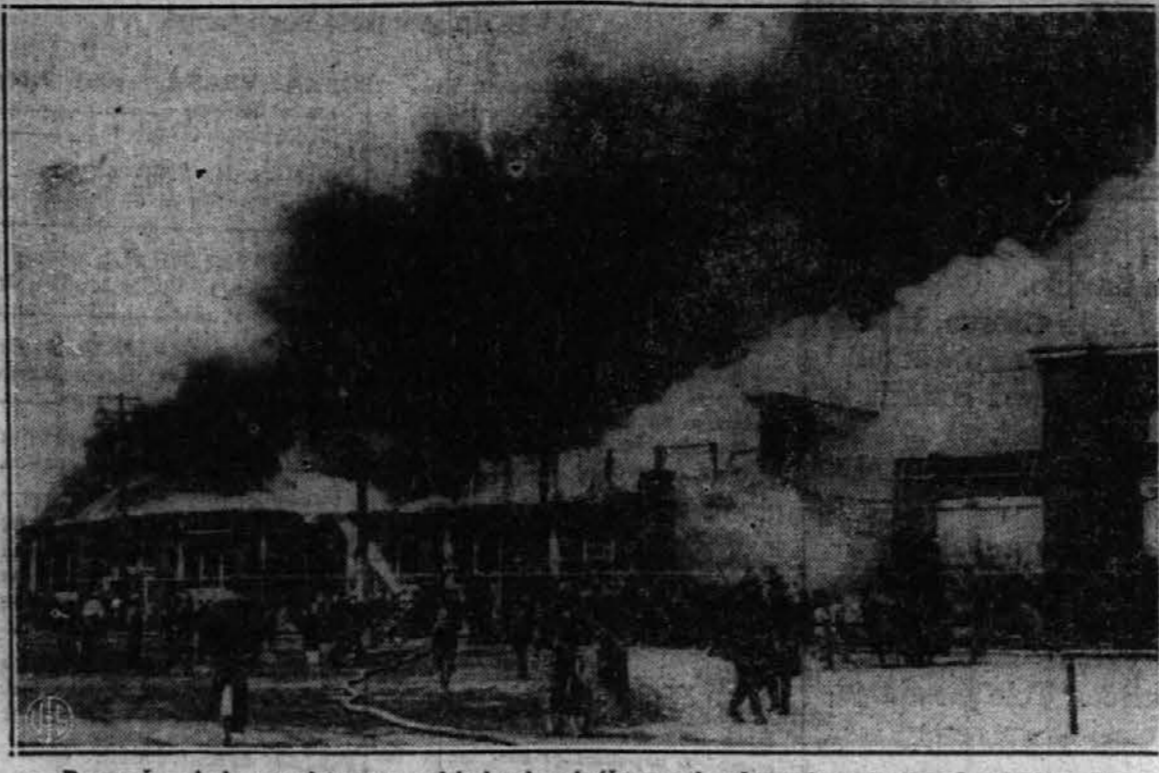
Povročeni, kakor se domneva, od kake, bresbrino proč vrzene cigarete, je požar, ki je nedavno izbruhnil na prostorih državne razstave v Detroitu, napravil za okrog $200.000 škodo. Le temu, da se je veter obrnil, se je najbrž zahvaliti, da ni postalo žrtve požara 1.500 novih avtomobilov v sosednjih poslopih.