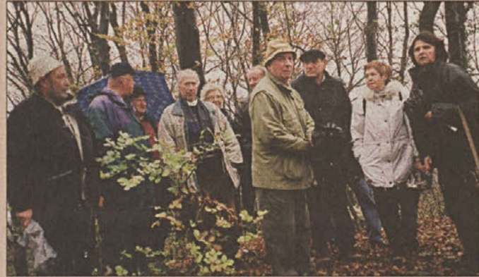
Slovenski novinarji na Dunaju...