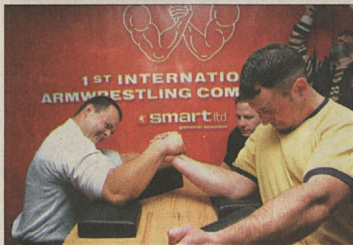
"Mornarček" ni več le gostilniški šport, saj na tekmovanju velja stroga pravila.

Vse cene, navedene v EUR, se preračunavajo v tolarje po tečaju, določenem v posredniški pogodbi na dan plačila nepremičnine.