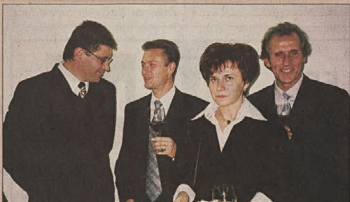
...brežiški socialdemokrati pa na zakuski