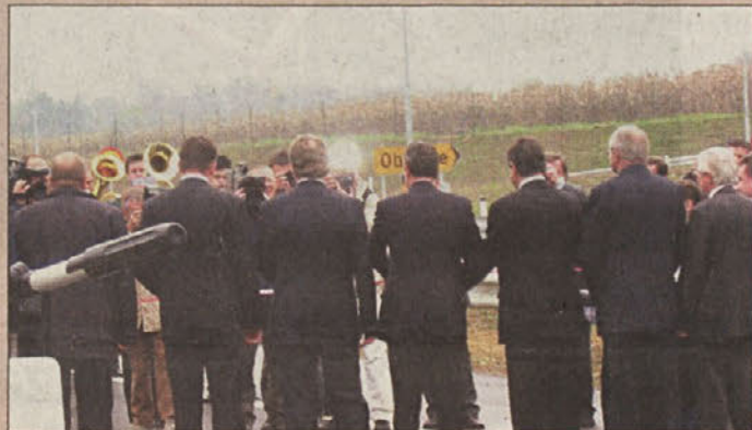
Ozadje neke otvoritve

da bi se morali že zdaj potegovati za večji izplen s cerkljanskega letališča in si izboriti