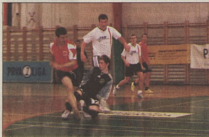
Dvoboj med vratarjem Rake in napadalci ŠD Boršt so dobili slednji, srečanje pa se je končalo z njihovim zmagovalcem s 4:2.