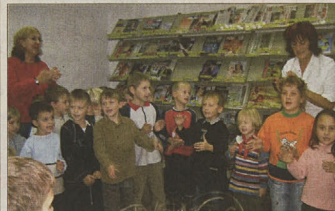
Malčki so bili pri petju sladki kot bonbončki.

Brežice - Otroci brežiškega vrtca Mavrica iz skupin Želvice in Bonbončki so med lanskim šolskim letom na posebnih plakatih predstavljali sebe in svoje družine, svoje najboljšje prijatelje, najljubšo hrano. Opisovali so tudi svoje počitnice ali domače živali, manjkale pa niso ni njihove številne fotografije od prvih korakov naprej in avtoportreti. Pri tem so jim včasih pomagali tudi starši, skupaj pa so se domislili, da bi pristrčne opise na nek način trajno zabeležili. Tako so oblikovali knjigo, večino dela so postorili starši, ki so ob koncu leta knjigo dobili za spomin. Pred kratkim pa so jo predstavili v brežiški knjižnici, kjer je knjižničarka starše spodbudila, naj berejo z otroki in pogosto prihajajo k njim, saj le knjiga požene korenine v srcih. Vsako od skupin Želvice in Bonbončki, tako se imenujeta tudi knjigi, je lani obiskovalo 24 nadobudnežev, nekateri od njih letos že hodijo v "ta pravo šolo". Da so malčki tudi nadarjeni pevci, so pokazali s širokim repertoarjem otroških pesmi o frnikoli, pa o gosenci in lisici in še marsičem, obe nekdanji skupini pa sta skupaj zapeli tudi svojo himno. M. K.