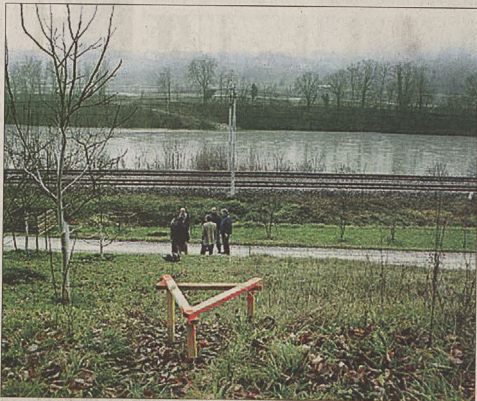
...na strani 3 Tako se začne...

Javna razgrnitev in javna obravnava predloga DLN za HE Blanca, ki je potekala na Blanci, je zaključena, prebivalstvo pa nezadovoljno. Krajanje Boštanj menijo, da bi morale javne obravnave potekati v vseh prizadetih KS in protestirajo proti takšni obravnavi tam živečega prebivalstva. Od takrat, ko so bile podane smernice lokalne skupnosti, pa do danes se je v načrtih marsikaj spremenilo. Skratka - številni domačini ugotavljajo, da predlog DLN vsebuje ukrepe za poslabšanje in ne izboljšanje razmer v lokalni skupnosti. Kot ocenjujejo, tak pristop kaže na vzvišeno aroganco ter nespoštovanje lokalnega prebivalstva in tradicije kraja.