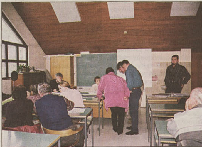
Sestanek s kmeti

sredno ogroženi. Poleg tega Boštanjčani opozarjajo, da ni upoštevana ureditev glavne ceste po nasipu do Mirenskega mostu, prav tako ni upoštevana ureditev lesenega mostu preko Mirne, ni zahtevanega pločnika med Boštanjem in Radno ter na severnem delu glavne ceste na Logu. Med drugim ni predvidena ureditev iztočnega dela Globoškega in Mivškega potoka. Izkušnje iz obratovanja HE