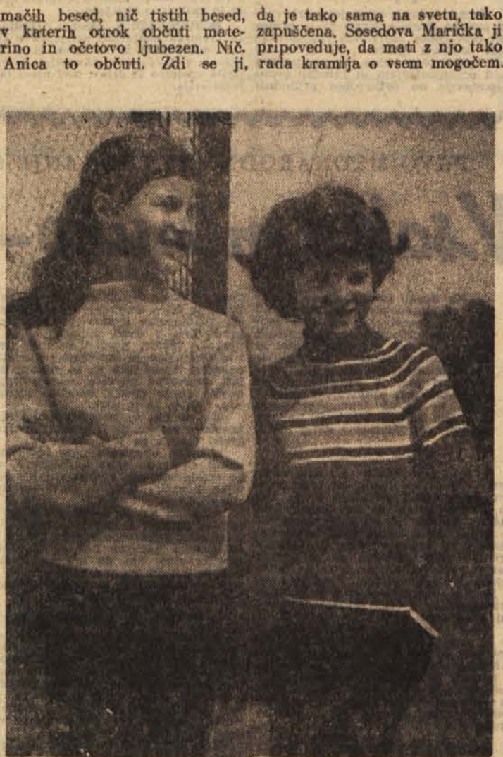
Škoda, če za tako ljubki hčerki ne bi imeli časa