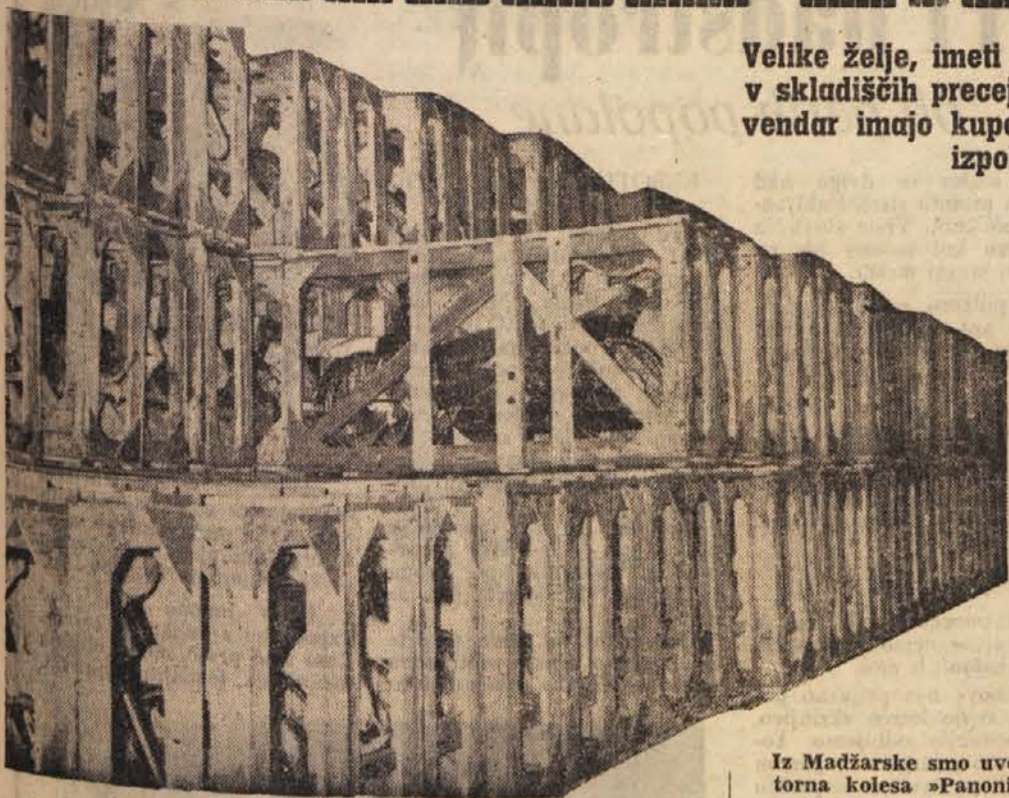
Iz Madžarske smo uvozili motorna kolesa »Panonia«. Zdaj so še v zabojih, v kratkem pa bodo na avkejši v Beogradu prodana trgovini

Velike želje, imeti avto ali moped — Čeprav čaka v skladiščih precej avtomobilov in motornih koles, vendar imajo kupci še zmerom ovinkasto pot do izpolnitve svojih želja