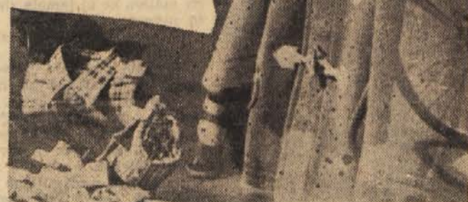
Dosti prej kot pri nas se je prodaja izgotovljenih oblačil uveljavila v drugih državah. Obe prednosti konfekcije: kupljeno je izgotovljeno oblačilo brez čakanja in pomerjanja, in nizka cena, sta dali svoj pomemben prispevek k dvigu življenjske ravni.

Ker je izdelava oblačil obrtniškega značaja, so ti izdelki dragi, ne pa poceni, kar pričakujemo od konfekcije