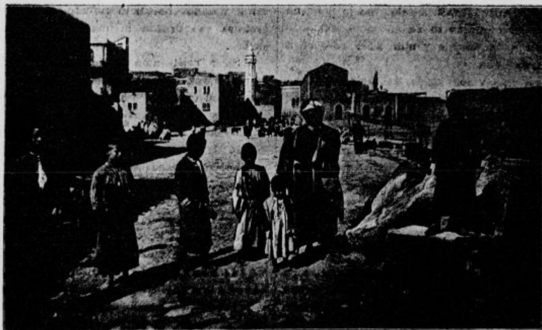
Glavni trg v Bettehemu.