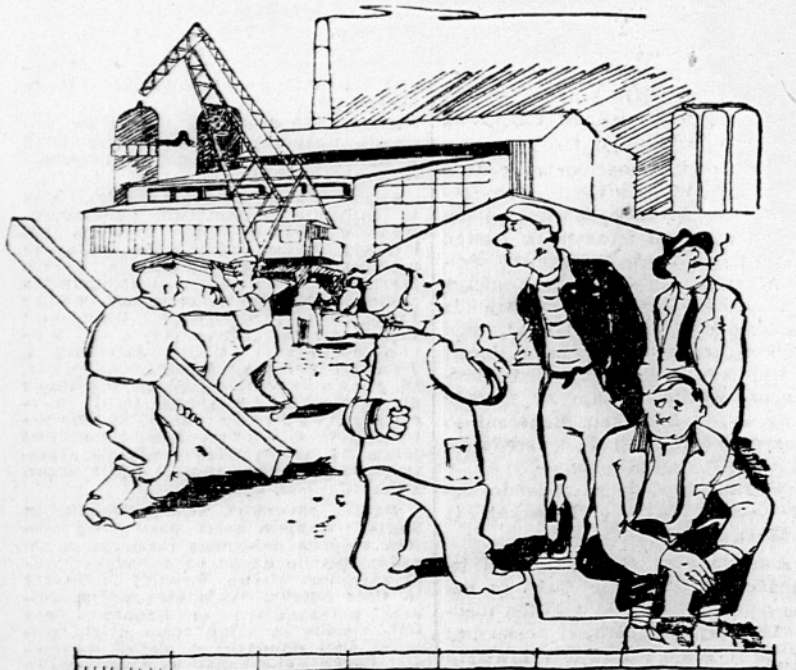
— Jaz pa pravim, naj bi nove plače odmerili kar z metrom, lepo pošteno vsakemu enako.

V Zagreb je prispelo iz Trsta 13 študentov slovenske narodnosti, ki bodo ostali nekaj časa v Zagrebu in drugih krajih Hrvatske kot gostje hrvatskih študentskih organizacij, da spoznajo življenje in delo študentov v naši državi.