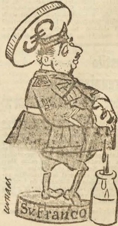
Novi ameriški svetnik

Washington, 2. marca. (Tanjug.) Reuter poroča: Vojaška oblastva ZDA se oporečala, da je bilo v Turčijo poslanih okrog sto lahkih tankov kot prvi del programa ameriške »pomoči« Turčiji.