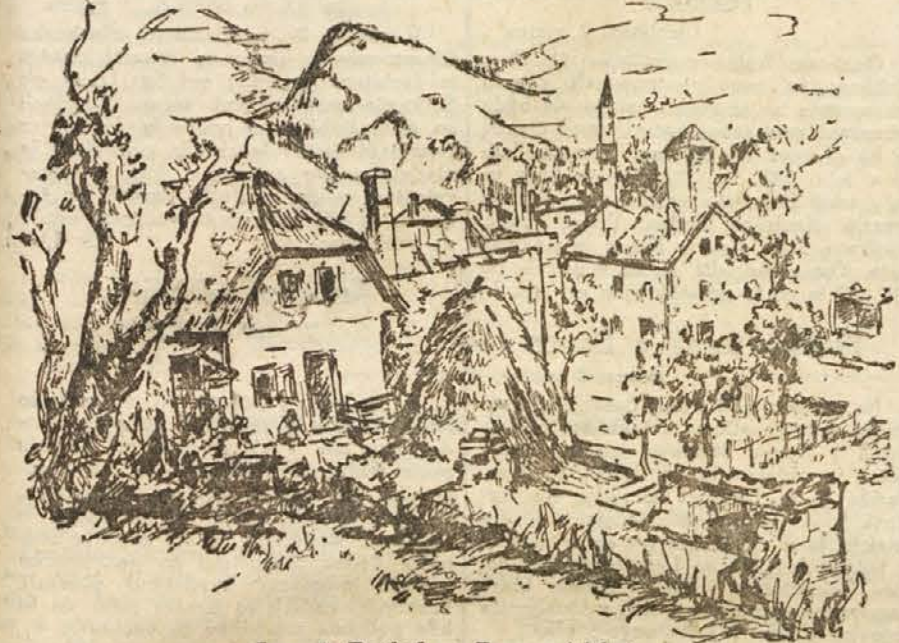
Lamut: Pogled na Prozor (risba)