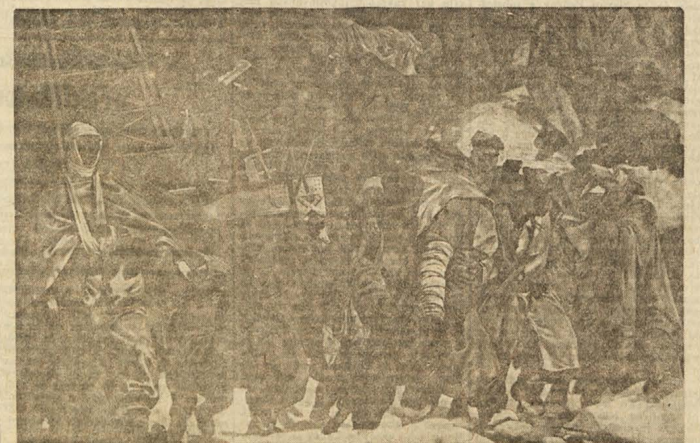
Slavko Fengov: Prenos ranjencev (izrez iredske)