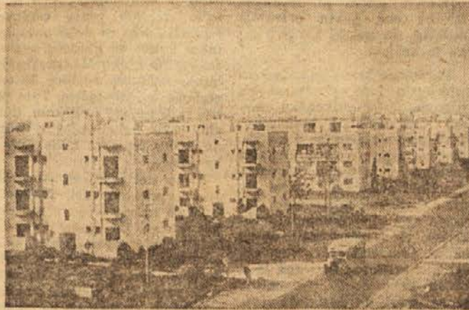
Izrael: Nove stanovanjske hiše v Tel Avivu

milijonov na naprave za umetno namakanje, 33 milijonov pa na elektrarne. Namakali bodo nad 94.000 ha zdaj nerodovite zemlje, in sicer 49.000 v Jordaniji, 42.000 v Izraelu