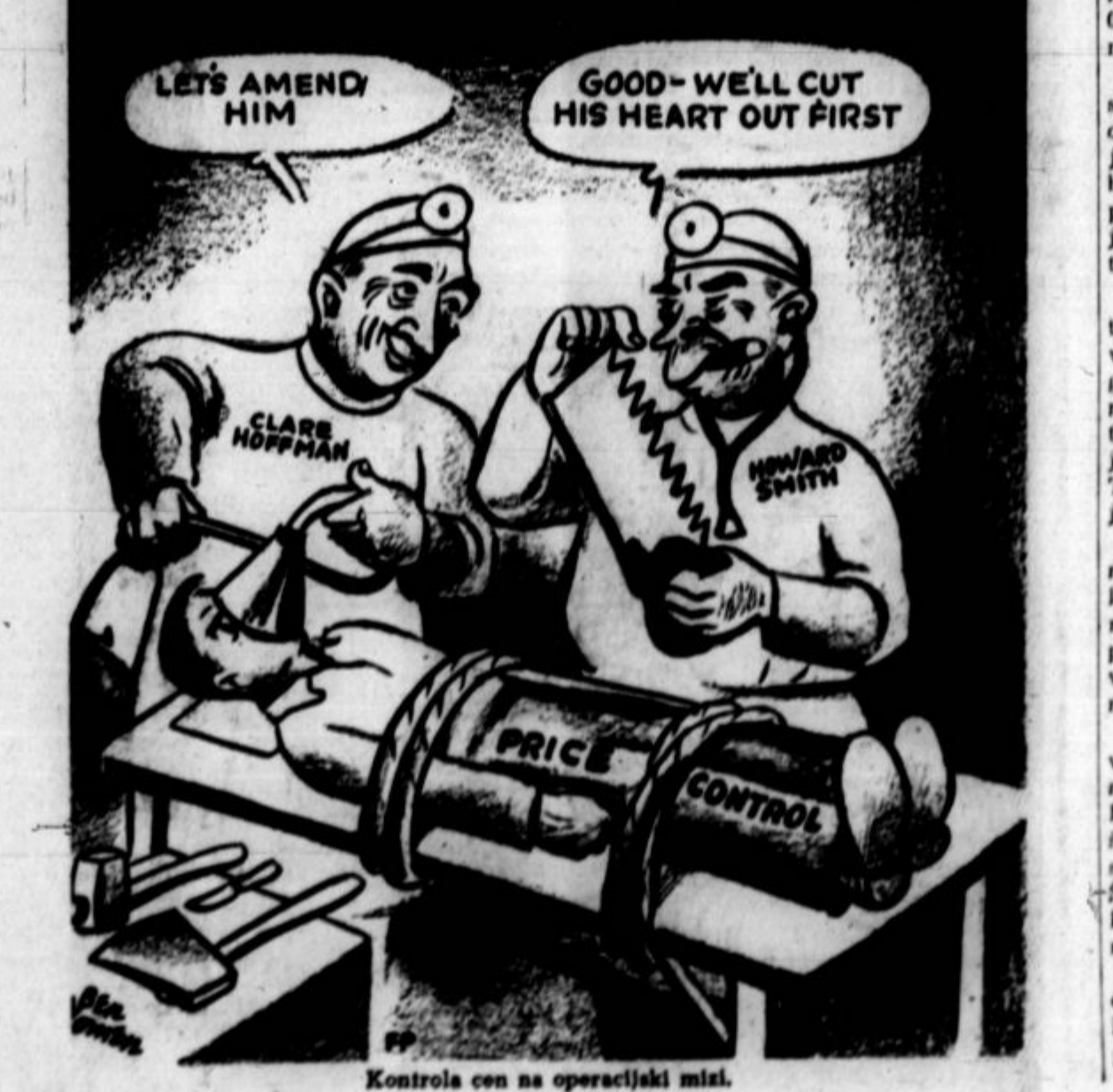
Kontrola cen na operacijski mizi.

London, 22. maja.—Zunanji minister Anthony Eden je informiral parlament, da so Nemci ustrelili 47 angleških, kanadskih in drugih zavezniških letalcev, ko so skušali pobegniti iz ujetniškega taborišča v bližini Dresdena. Edenovo naznanilo je izzvalo silno ogorčenje. Vladni krogi in javnost so obsodili dejanje kot brutalen zločin, za katerega bodo morali Nemci plačati kazen.