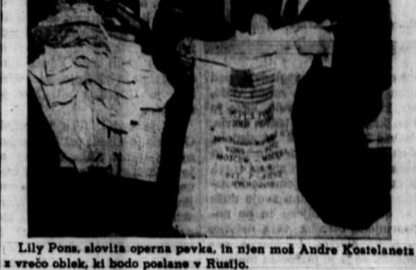
Lily Pons, slovita operna pevka, in njen mož Andre Kostelanetz z vrečo oblek, ki bodo poslani v Rusijo.