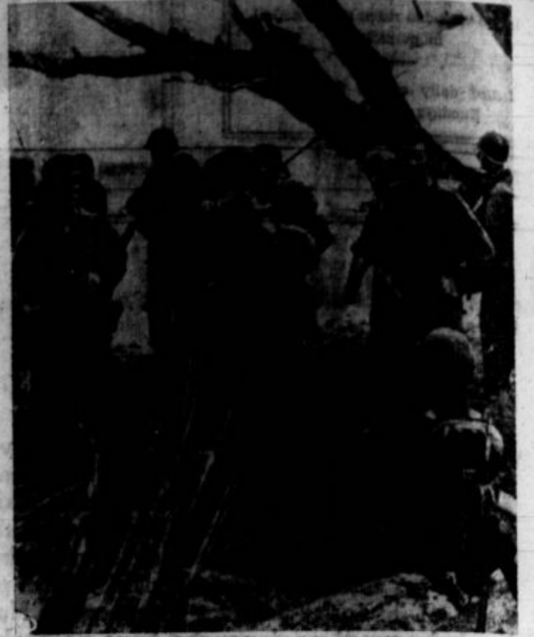
Ameriški vojaki na Hollandiji, otoku holandske Nove Gvineje.

Dogovorjeni sestanek se je res vršil in striženje las se je pričelo. Ampak mož zapeljivke se je dobro pripravil in poslal tri ženske, ki so stale za garažo in čakale, da se naklep izvede. Naenkrat so tiste tri ženske stopile v garažo in zasačile trgovca s