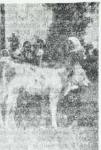
NA SEJMU RODOVNIŠKE ŽIVINE

V preusmerjevanju kmetijstva bodo odigrale glavno vlogo splošne kmetijske zadruge s svojimi gospodarskimi oddelki.