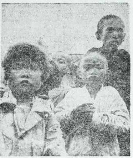
Strahovite posledice vojne na Koreji — sto tisoči otrok brez staršev tavajo po deželi.

Toda je prvi dnevi upravljanja novega predsednika so pokazali, da se pri njegovem do ne preveč lovo ravna po volilnem programu republikanske stranke, niti se dal vpiljati od onih prenapetih, ki bi mu lahko samo zmanjšali ugled v ZDA in v svetu. Morda se ta razvoj ne čuti v toliki meri v notranji političnem dopajanju. Dokaj očten pa je na področju znanje politike. Vesela novica, da so te dni na Koreji je zamenjali dve skupini bolnih in ranjenih vojni ujetnikov obeh borečih se strank, dokazuje, da so v Washingtonu popustili v odnosu do severnokorejskega in pozneje kitajskega napačca. Svoje trdoglavoosti so se odrekli tudi v Kitajski in severnokorejski prestolnici in celo ponudili nova popajanja za premirje. Kakor kažejo zadnja poročila, se bodo leta prišlo 25. 1. na celotno področje razmeroma hitrem sporazumevanju zadnjih dni, nas ne bo presenetilo, če bodo predstavniki Združenega poveljstva in kitajsko-severnokorejske armade rešili v nekaj dneh še edino sporno vprašanje predvidenega sponazovanja — celotno zamenjavo vseh vojnih ujetnikov na Koreji.