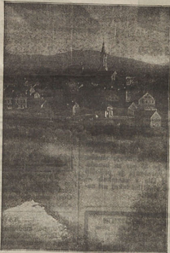
Novo mesto, dolenjska metropola.