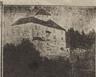
Troje domov v Dolini gradov: Gradovi Zalog, Klevč in Stari grad