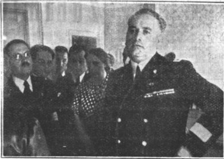
Visoki Komisar na obisku pri Rdečem križu