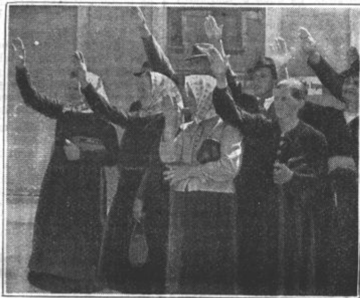
Žene iz Dolenje vasi pozdravljajo Visokega Komisarja