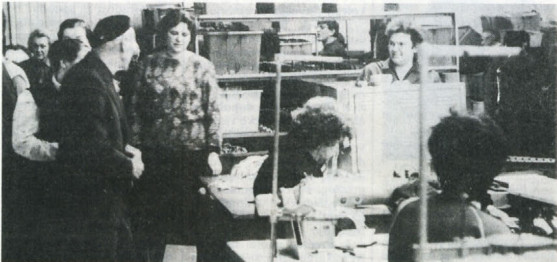
OBISK V PROIZVODNJI — Ob nedavnem sprejemu novih članov v Zvezo komunistov, ki je bil v našem tozdu v Črnomlju, so si mladi komunisti, pa tisti, ki so člani ZK že več kot 40 let ter številni gosti, ogledali tudi proizvodnjo. Zanimalo jih je predvsem, kako so z delom v novih oz. prenovljenih prostorih zadovoljne šivilje in druge delavke.

Kot vidimo iz delno načetih činiteljev, je požarna varnost sklop raznih ukrepov. Aktivna borba proti ognju ni torej samo stvar gasilcev, ampak je njena uspešnost v veliki meri odvisna od nas vseh, kot sklop posameznikov, ki s svojim