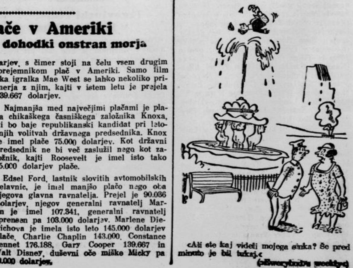
»Ali ste kaj videli mojega sinka? Še pred minuto je bil tukaj.«