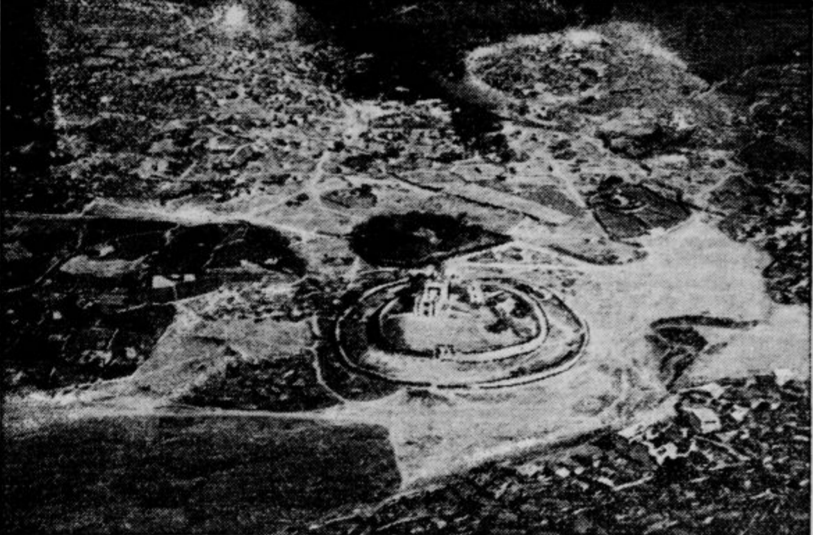
»Vogled iz aeroplana na Makalo, ki so jo abesinske čete že popolnoma obkobile