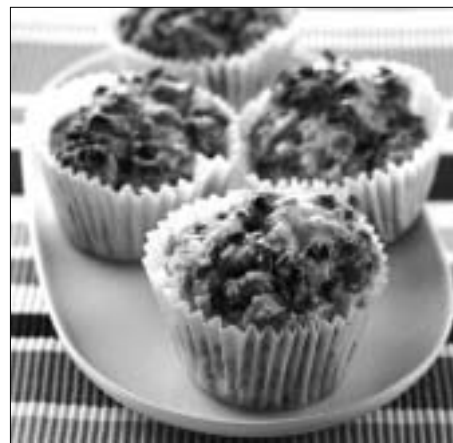
Bananini kolački z vanilijevo omako

Potrebujemo: 1 banano, 125 g zmehčanega surovega masla, 1 jajce, 1 vanilijev sladkor, 20 dag bele moko, 10 dag rjavega ali belega sladkorja, vrečko pecilnega praška, pol žličke soli, 8 do 10 dag grobo sesekljan temne čokolade