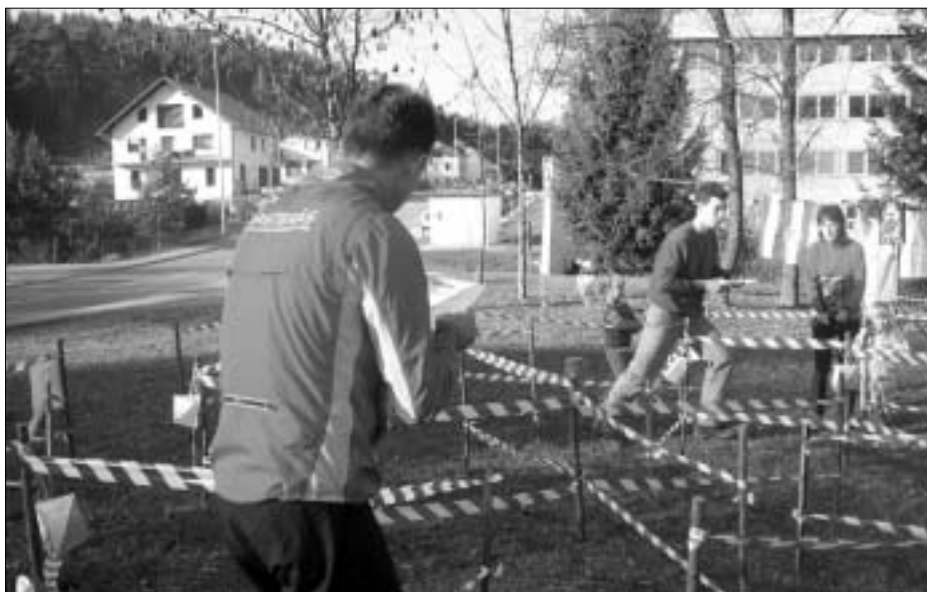
Orientacija v labirintu zahteva veliko spretnosti.

Kaj je pravzaprav orientacijski tek? To je športna panoga, pri kateri mora tekmovalec le s pomočjo karte in kompasa čim hitreje priti od starta do cilja in pri tem najti vse kontrolne točke, ki so na karti vrisane v točno določenem vrstnem redu. Gre za šport, ki izvira iz Skandinavije, kjer ima že dolgo tradicijo. Pri tem sta enakovredno pomembna tako fizična kot tudi psihična aktivnost. Tekmovalec mora med samim tekom misliti. Razmišljati mora, kje se nahaja, na kakšen način bo našel kontrolne točke na terenu, po kateri poti bo najhitreje prišel do naslednje kontrolne točke in do cilja, kako hitro naj gre po progi, da ne bo pri tem naredil napake itd. Zato je potrebno kar nekaj znanja, ki si ga je mogoče pridobiti s posebnimi treningi posameznih veščin.