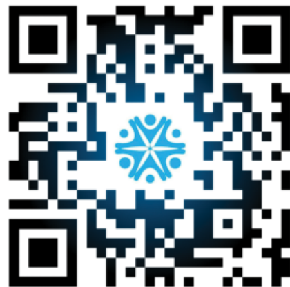
Celoten urnik dejavnosti v Medgeneracijskem centru Vezenine Bled po prostorih.