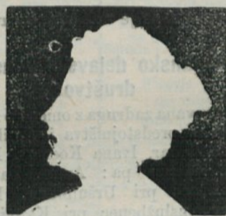
Ein heller Kopf verwendet stets