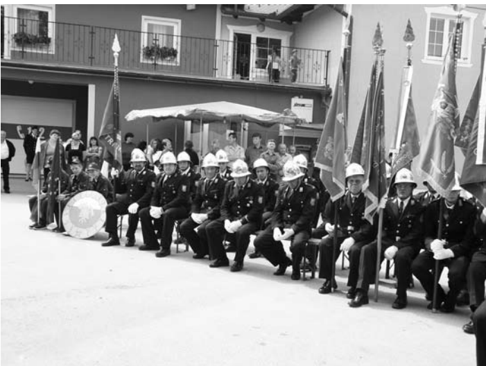
Občan - 24. julij 2009