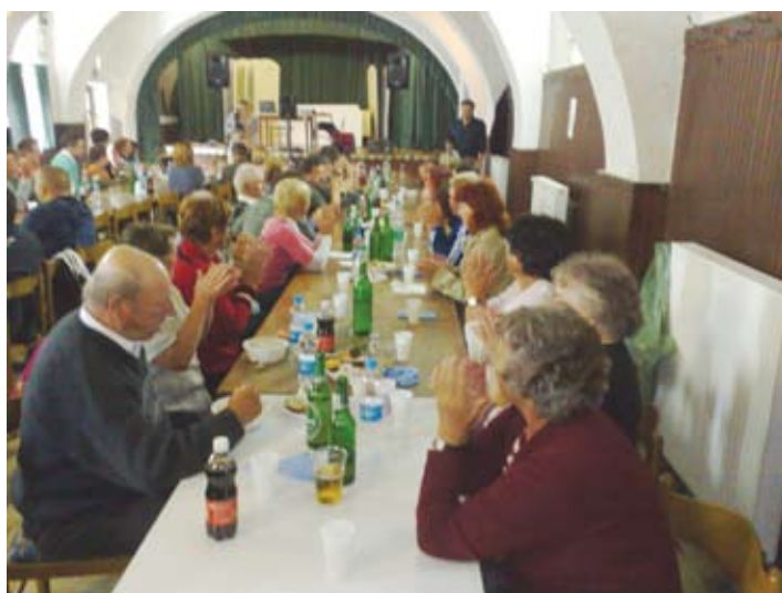
Na pikniku se je zbralo 65 ljudi