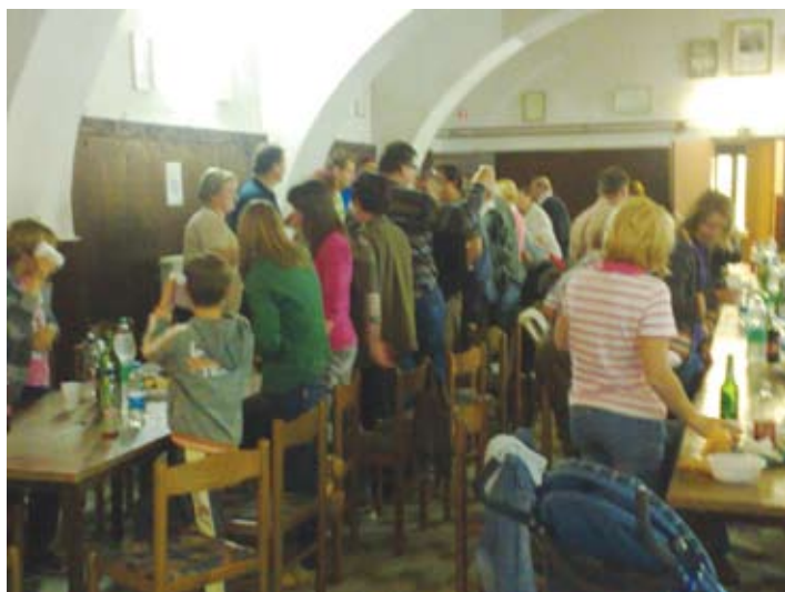
Vaščani so se zabavali dolgo v noč