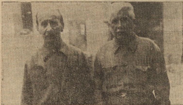
DVA TRŽAŠKA KOVINARSKA DELAVCA

»Prej si moral stati kot kužek pred gospodarjem. Delavec je bil odvisen popolnoma od milosti ali nemilosti delodajalca, ki ga je za vsako malenkost ali tudi za nič kaznoval ali celo odpustil z dela. Po tovarnah smo imeli naše notranje odbore, toda bili so brez vsakega vpliva in niso imeli pri gospodarju nobene besede. Zdaj je nekoliko drugače, čeravno še davno ne tako, kakor bi