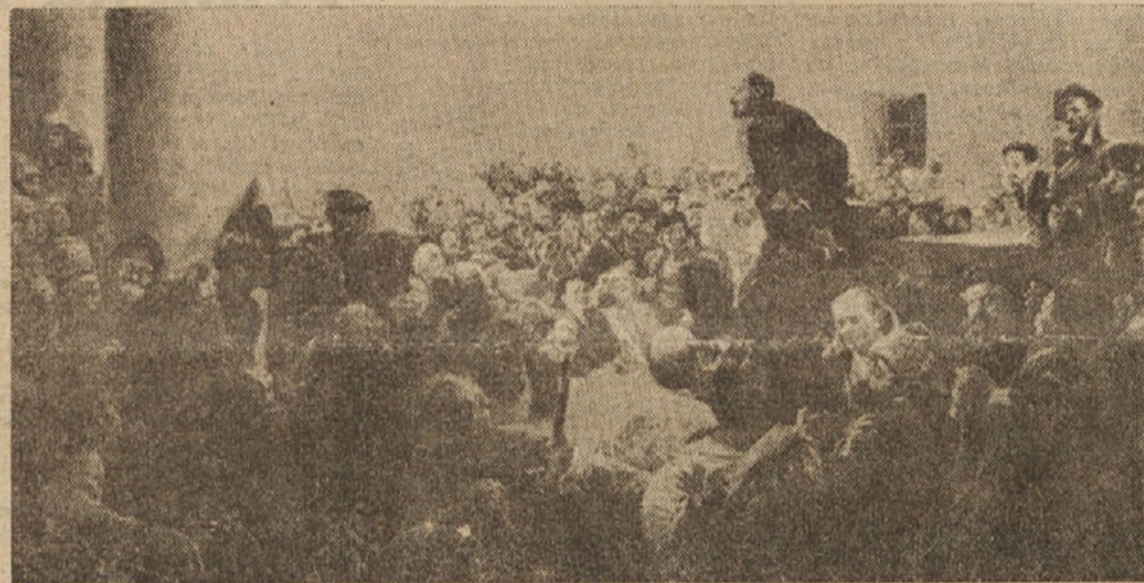
VLADIMIR ILJIČ LENIN NA II. VSERUSKEM KONGRESU SOVJETOV DELAVSKIH IN VOJAŠKIH ODPOSILANCEV 25. OKTOBRA (7. NOVEMBRA) 1917. V SMOLJNEM

njegovih priganjačev, ki si na moč prizadevajo razbiti delavske vrste in demokratsko ljudsko fronto, ki je še posebej po ustanovnem kongresu SIAU za Tržaško ozemlje v najširšem merilu zajela vse demokratske sloje na naših tleh.