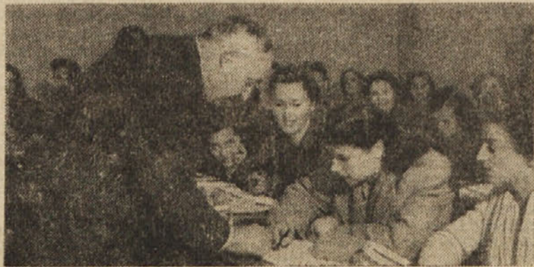
KROJNI UCITELJ MED UCENKAMI V STROKOVNEM KROJNEM TEČAJU PRI SV. ANI

Na svidenje ob zaključku tečaja ali pa še prej! Dotlej pa je marljivo in pridno naprej! Zadovoljno si