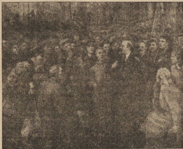
LENIN V RAZGOVORU Z BORCI, KI ODHAJAJO NA FRONTO

To je napisal Marx o Nemčiji petdesetih let, o kmečki deželi, kjer