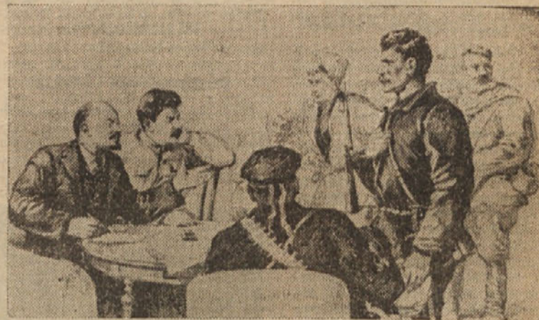
RDEČEARMJCI PRI LENINU IN STALINU

»Pa še nekaj ti bom povedal«, je dodal njegov tovariš. »Ves svet je videl napredek Sovjetske zveze od Oktobrske revolucije. Če ne bi bilo Lenina, ki je dvignil ruski narod in