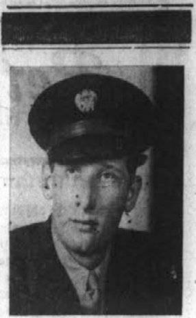
V BLAG SPOMIN ČETIRTE OBLETNICE SMRTI NAŠEGA PRELJUBLJENEGA IN NIKDAR POZABLJENEGA SINA IN BRATA