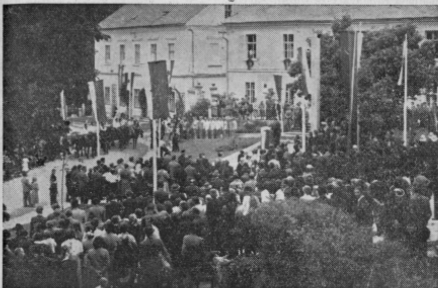
Takole praznujejo Šmarčani vsako leto svoj občinski praznik.

Šmarje pri Jelšah, središče kmečke občine, praznuje vsako leto 8. avgusta svoj občinski praznik. Pred trinajstimi leti je bilo, ko so partizanske enote izvedle obsežnejši napad na okupatorja, ki se je vgnezdil v lepem šmarskem trgu. Toda čas beži. Šmarje je pretrpelo, Šmarje je kot mnogo slovenskih krajev plačalo za svobodo velik krvni davek. Danes Šmarčani delajo v želji, da bo vedno lepše.