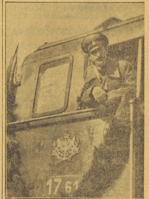
Die neue, 33 Kilometer lange Eisenbahnlinie Dupnica—Djumaja westlich von Sofia wurde in diesen Tagen von König Boris von Bulgarien eingeweiht. Der König, den man hier auf der Lokomotive sieht, führte selbst den ersten Zug auf der neuen Strecke. Die neue Linie verbindet das Strumatal mit dem bulgarischen Zentrum und wurde mit einem Kostenaufwand von 70 Millionen Lei erbaut