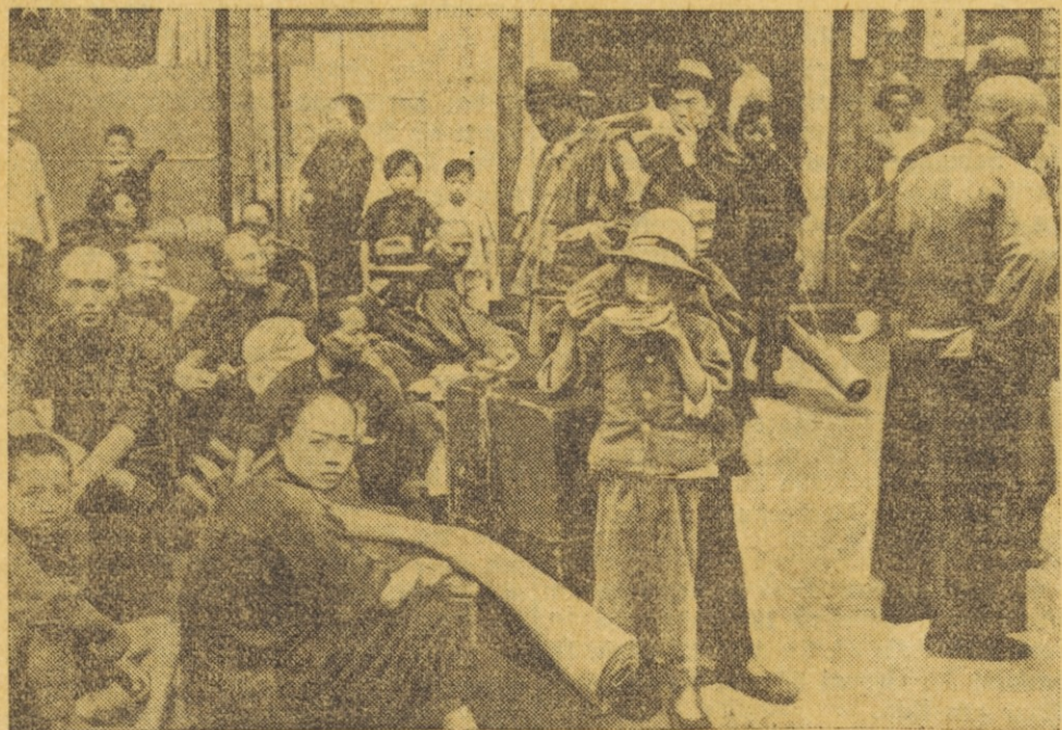
Die chinesische Bevölkerung in den Kampfgebieten hat unter den chinesisch-japanischen Kämpfen schwer zu leiden. Hier warten Flüchtlinge aus den Kampfgebieten in der französischen Konzession in Schanghai auf den Abtransport in die großen Flüchtlingslager.