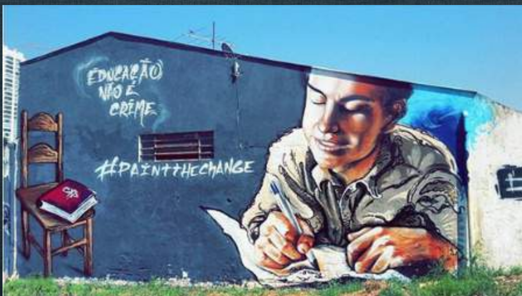
Paint the Change

We live in a society that has come to rely on two ideas that are damaging us and are limiting our future. One is materialism, the idea that we measure our lives only through the acquisition of wealth and material consumption, and that through those activities we find fulfilment; but all of this at the expense of community ideals, personal development, and so on. A second damaging idea is individualism – where the needs of an individual take precedence over the community. Social responsibility challenges both of those concepts because it places an individual in a community, recognizes that everybody is connected and that we have a role in the well-being of others. And this is an idea that is neither individualistic nor materialistic. The idea relies on a more humane appreciation of the role of a person and one that goes beyond simple material measurements; it has to do with the development of people's self-esteem, resilience, and their physical, mental and emotional well-being. And it looks at the needs of others.