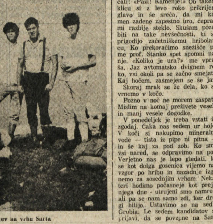
Skupina planincev na vrhu Sarta