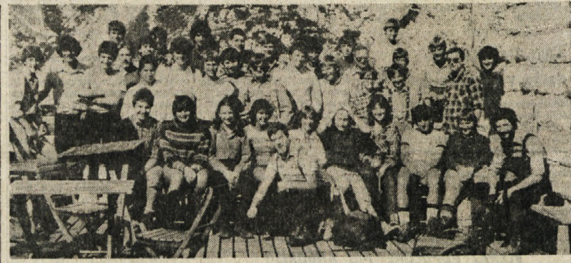
Obvezna skupinska slika pri koči Gilberti pred vzponom na Kanin in na Prestreljenku

Dijaki in profesorji, ki so se na tem izletu povzpeli na vrh Sarta, ki je ena izmed glavnih točk te poti, pa imajo torej lepe možnosti, da na prihodnjih izletih osvobodijo značilni, ki je namenjena tistim, ki prehodijo celotno «Rosojansko pot». Da se boje seznanili s potekom dogajanja, pa prisluhnimo zdaj pripovedi enega izmed izletnikov oz. izletnic.