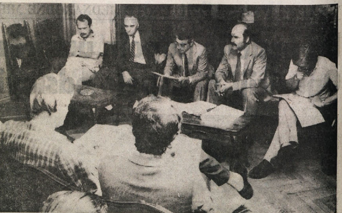
Vodstvo Slovenskega stalnega gledališča je včeraj s tiskovno konferenco v prostorih Carnarskega krožka predstavilo repertoar za sezono 1982/83.

V abonmaju 6 predstav (4 v lastni postavitvi in 2 gostovanji), izven abonmaja 2 predstavi, povrh se dela za otroke in šole - Avtorja novitet sta Matjaž Kmecl in Alojz Rebula