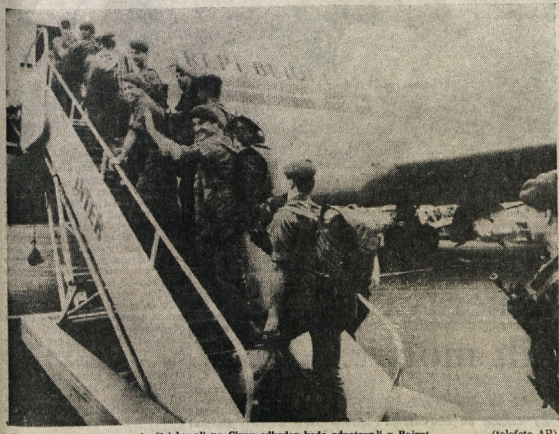
Francoski padalci so se sinoči izkrkali na Cipru odkoder bodo odpotovali v Bejrut

Izraelski premier se je v parlamentu s pičlo večino izognil preiskavi, ki bi morala razkriti njegove odgovornosti pri bejrutskem pokolu