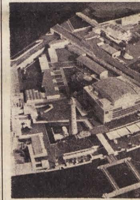
Pogled iz zraka na razstveni prostor v Londonu. Na desni je »Palača odkritij in iznajdb«, na levi pa stolp »Skylons«, simbol festivala; spredaj znameniti most Waterloo, ki veže razstveni prostor s središčem mesta

njak, in sicer v nekaj minutah. Razen črk, krogičnih ležajev in glavnega ploščatega ročaja za premikanje valja je izdelan ves stroj iz domačega gradiva. Ker v Sloveniji že izdelujemo črke za pisalne stroje, nam jih ne bo treba uvažati, ko bomo začeli v serijah izdelovati pisalne stroje. Prvo poizkusno serijo bodo izdelali v začetku prihodnjega leta, in sicer okrog 30 pisalnih strojev.