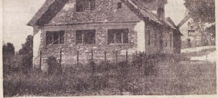
Šola v Sv. Vidu