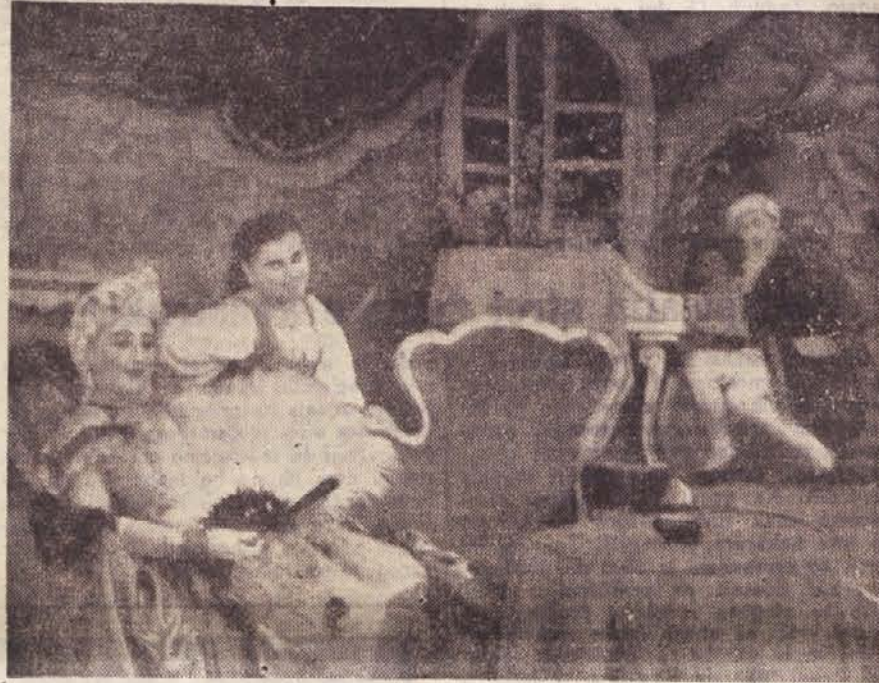
Igralska skupina jeseniške metalurške šole igra »Matička«. Te dni gostuje v Kopru