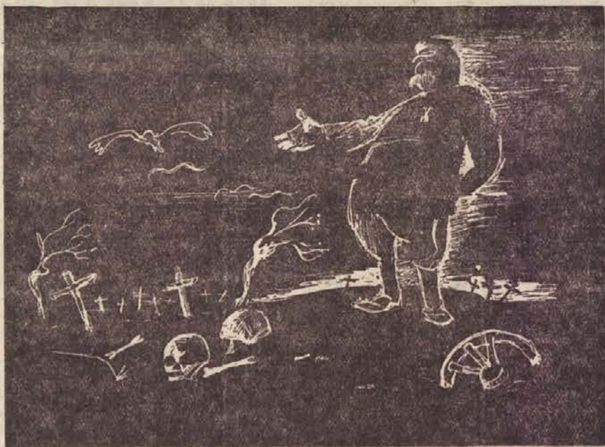
Razrušena mesta, glad, lakota, kužne bolezni, 1.070.770 pobitih Severnokorejcev in Kitajcev ter 141.221 ameriških vojakov — taka je bilanca vojne na Koreji, ki se je začela lani 25. junija