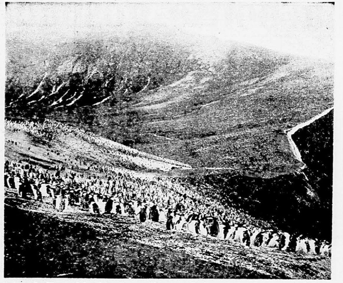
»Najmogočnejši, resni in slovesni gospodje...« — Parlament pingvinov na pobočjih antarktičnega otoka Prevare

pa se je vrnil, žene ni bilo nikjer. Pozneje je zvedel, da je ženi poslal pisemce njen bivši zaročenec in zahteval od nje, naj mu sledi na Daljni Vzhod, kamor je moral še isti večer odpotovati s svojim polkom. V hipu se je žena odločila, odhitela na postajo in odpotovala s svojim prejšnjim zaročencem na Vzhod, kjer se je pozneje tudi poročila. Londončan pa je vse življenje upal, da se bo žena vrnila, zato je ob vsakem vremenu hitel na Rotten Row. Da bi ga žena takoj spoznala si je v starejših letih barval lase. Zadnje dni, ko že ni mogel več ven, pa je ob oknu čakal na ženo, ki se ni nikdar več vrnila.