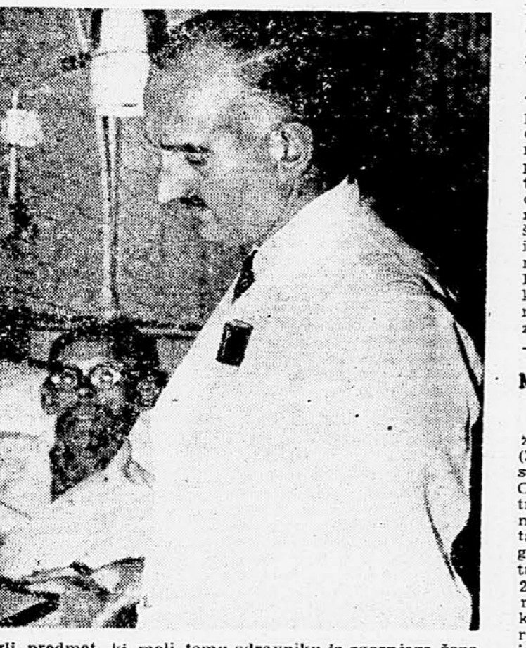
Okrogli predmet, ki moli temu zdravniku iz zgornjega žepa, je miniaturni radijski sprejemnik. Vsak zdravnik v eni izmed največjih londonskih bolnišnic je opremljen s takim sprejemnikom. V nujnih primerih lahko pokličejo iz centra vsakega posameznega zdravnika ali vse skupaj, ne da bi pri tem motili bolnike po zvočnikih.

Največje elektronske orgle na svetu Neka ameriška tovarna je zgradila za studio v Macungie (ZDA) elektronske orgle na štiri manuale s 95 registri. Orgle so po ugotovitvah električnih strokovnih revij največje na svetu. Posamezne tastature so opremljene z registri takole: 1. Ročna klaviatura 22, 2. ročna klaviatura 21, 3. ročna klaviatura 15, 4. ročna klaviatura 15, nožna klaviatura 22 registrov. Prva ročna in nožna klaviatura imata enakomeren glas, vse ostale pa nihajo. Instrument bodo uporabili za snemanje gramofonskih plošč z orgelsko glasbo in za predvajanje velikih opernih skladb.