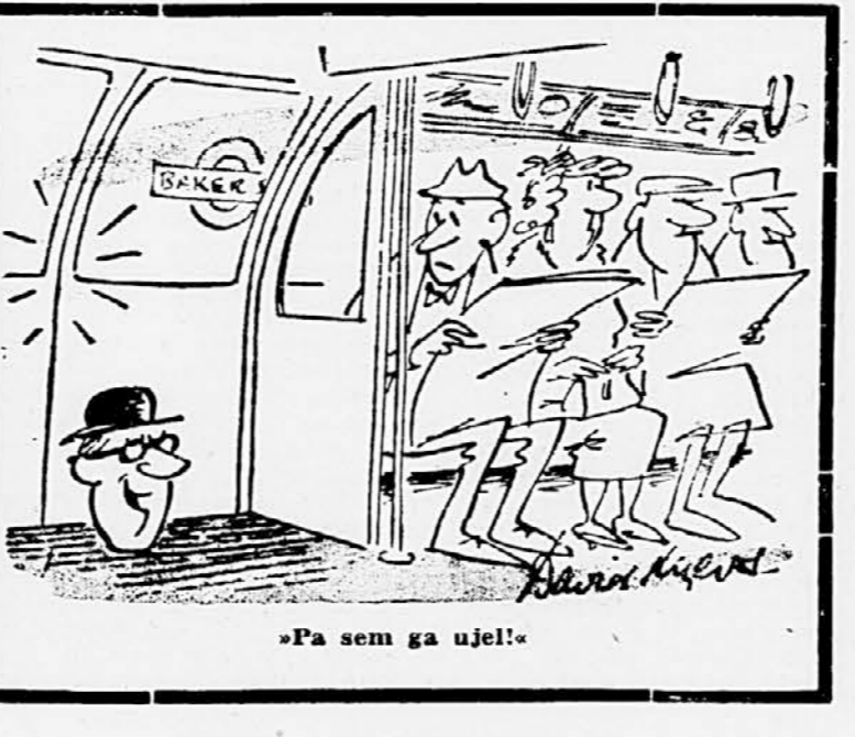
»Pa sem ga ujel!«