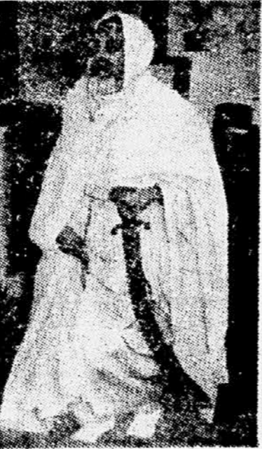
Libijski kralj Idris

vi - Sforza - imenovan po letkah zunanjih ministrstev Velike Britanije in Italije. Po tem načrtu naj bi Libijo razdelili na tri kose: Fezzan naj bi dobili Francozi, Cirenajko