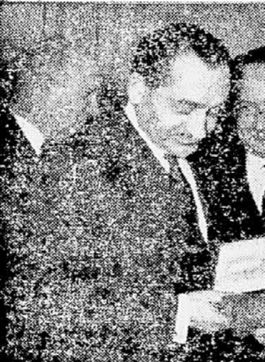
Bivši predsednik francoske vlade Mendès-France izročila Mimounu lepo plaketo