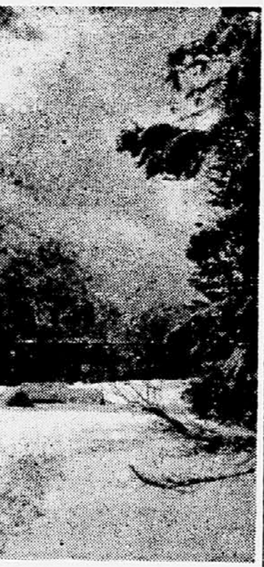
Planina Javornik na Pokljuki

• Sung — dinastija kitajskega cesarstva (960—1279), znana po dovrženosti v umetnosti, literaturi in filozofiji. — Op. prev.