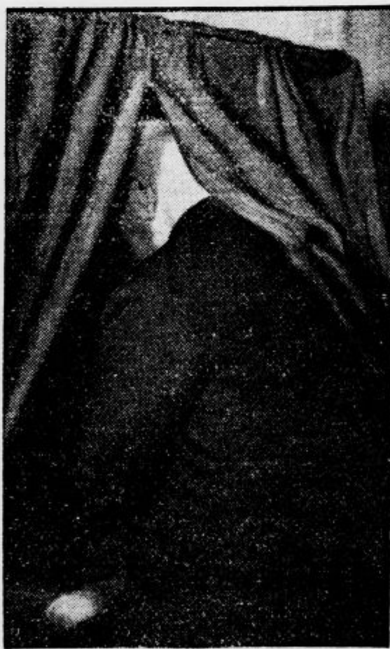
Predsednik nemške republike pri nedeljskih državnozbornih volitvah