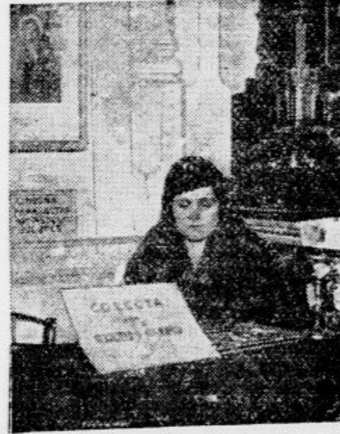
Po revoluciji so v Španiji izvedli ločitev cerkve od države. Ker je s tem cerkev izgubila svoje dohodke, se zdaj zbirajo prispevki za vzdrževanje poslopj s kolektami pred vhodom v cerkveni bram