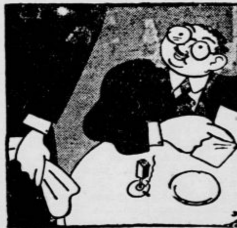
»Kaj ste naročili, gospod?« »Naročil sem Martinovo gos, ampak zdaj že teko dolgo čakam nanjo, da bo najboljša, če mi prinesete jagode.«