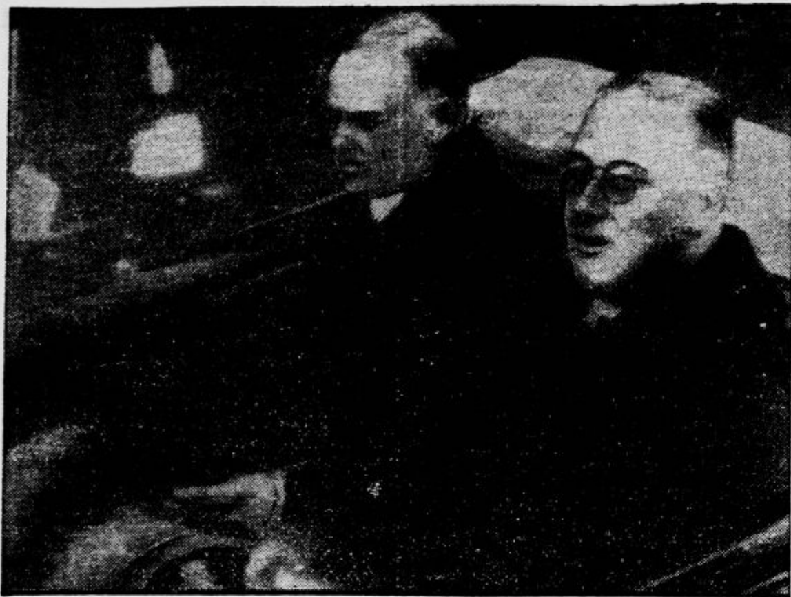
Novi ameriški predsednik Roosevelt (z naočniki) se pelje s starim predsednikom Hooverom na washingtonski Kapitol, da prevzame od njega državne posle