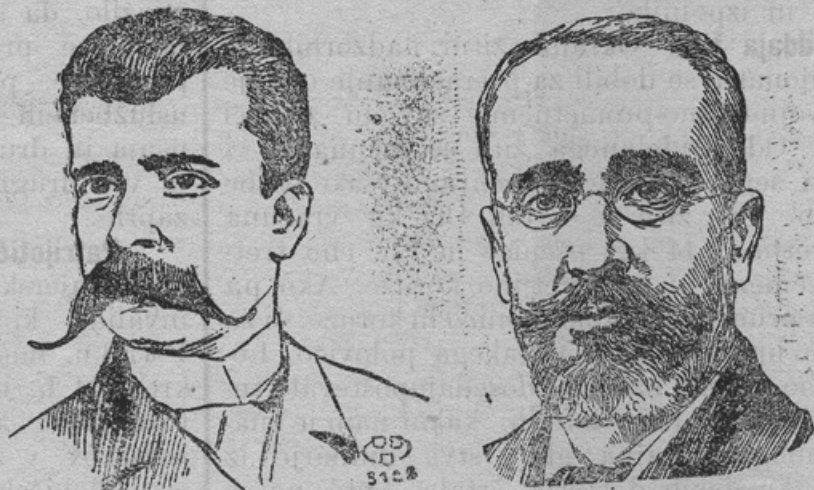
Ministrski predsednik Veniselos

Na Grškem so zopet velike notranje politične zmešnjave. Dosedanja vlada z ministrskim predsednikom Zaimis, katerega sliko prinašamo, je odstopil. Ali tudi nova vlada gotovo ne bode zmešnjave spremenila. — Obenem prinašamo sliko bivšega grškega ministerskega predsednika Veniselos. Ta možakar, ki je podplačan od francosko-angleškega zlata, spada med najstrastnejše hujskače proti nam in našim zaveznikom. V zadnjem času pa je tudi med grškim prebivalstvom