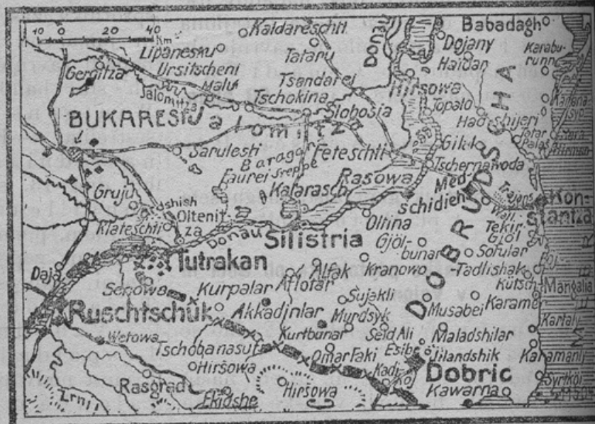
Zum deutsch.-bulg. Vormarsch.

Brodovje pomorskih letal je v noči od 16. na 17. septembra železniške naprave od