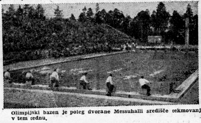
Olimpijski bazen je poleg dvorane Messuhalli središče tekmovalni v tem tednu.

Prvi gol je dosegla Jugoslavija v tretji minuti igre. Kurinji je izvedel kor, žoga je padla v prazen prostor pred madžarska vrata, Sta-